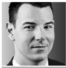
HUGO DUMAS CHRONIQUE

Le projet de remake des Belles histoires des pays d'en haut , façon western hyperréaliste à la Deadwood de HBO, progresse rondement à Radio-Canada. Les trois premiers épisodes d'une heure ont été déposés par l'auteur Gilles Desjardins, les trois suivants sont pratiquement achevés et trois autres devraient sortir du four au printemps.