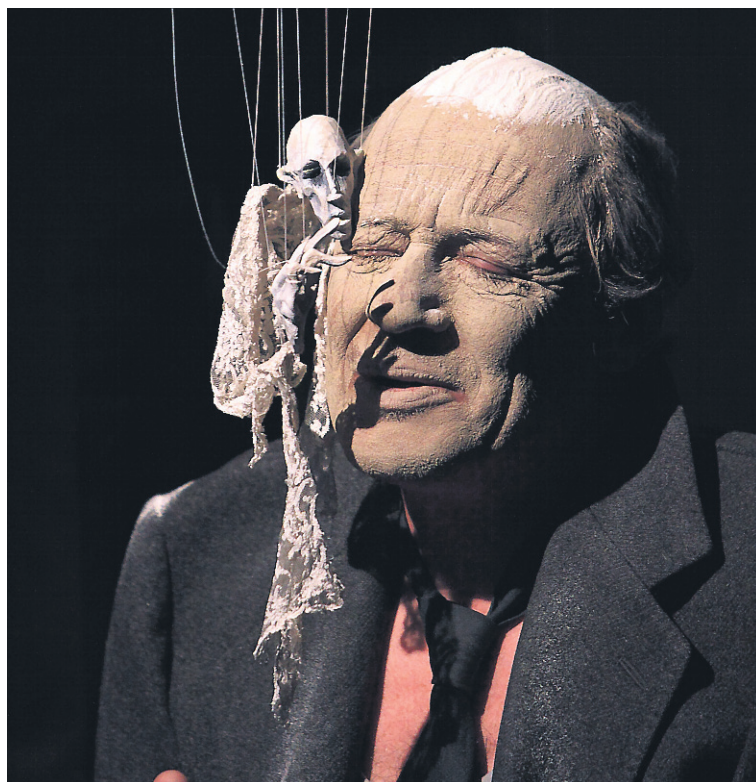
Une scène de la pièce Hôtel de rive , basée sur des textes du peintre et sculpteur Alberto Giacometti.