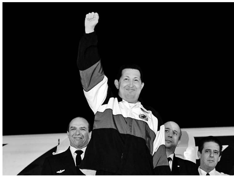
Le président du Venezuela, Hugo Chavez, lève le poing en rentrant au pays après son opération à Cuba pour un cancer.

Le président du premier exportateur de brut latino-