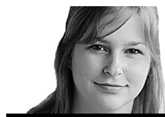
JANIE GOSSELEIN JÉRUSALEM

Liberté d'expression ou racisme? Un texte controversé soulève le débat en Israël. Deux rabbins sont soupçonnés d'incitation à la violence pour l'avoir appuyé. Mais leurs partisans manifestent dans les rues et s'insurgent contre l'intrusion du système judiciaire dans ce qu'ils perçoivent comme une affaire purement religieuse.