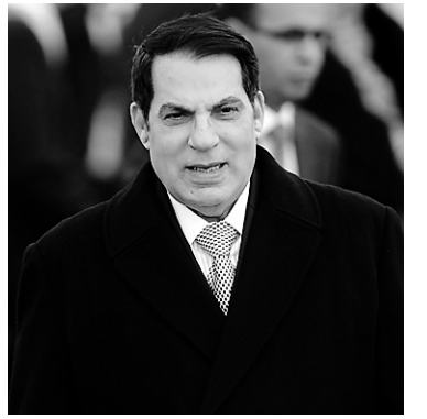
L'ex-président tunisien en exil, Zine el-Abidine Ben Ali, a été condamné à la prison.

L'ex-président tunisien Ben Ali a été condamné par contumace à 15 ans et demi de prison pour détention d'armes, de stupéfiants et de pièces archéologiques, à l'issue d'un procès déserté par ses avocats qui estimaient les droits de la défense bafoués. Le président déchu a également été condamné à une amende de quelque 75 000 $ dans cette affaire dite du « palais de Carthage ». — AFP