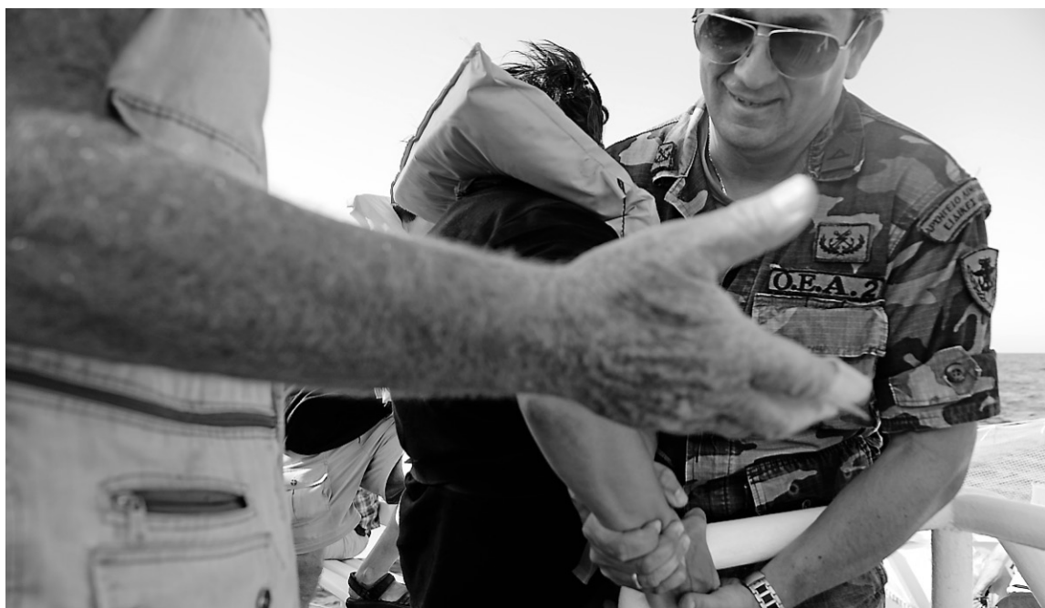
Des militaires grecs montent à bord du Tahrir , ce navire où se trouvent des militants canadiens qui cherchent à se rendre au territoire palestinien de Gaza pour défier le blocus israélien.