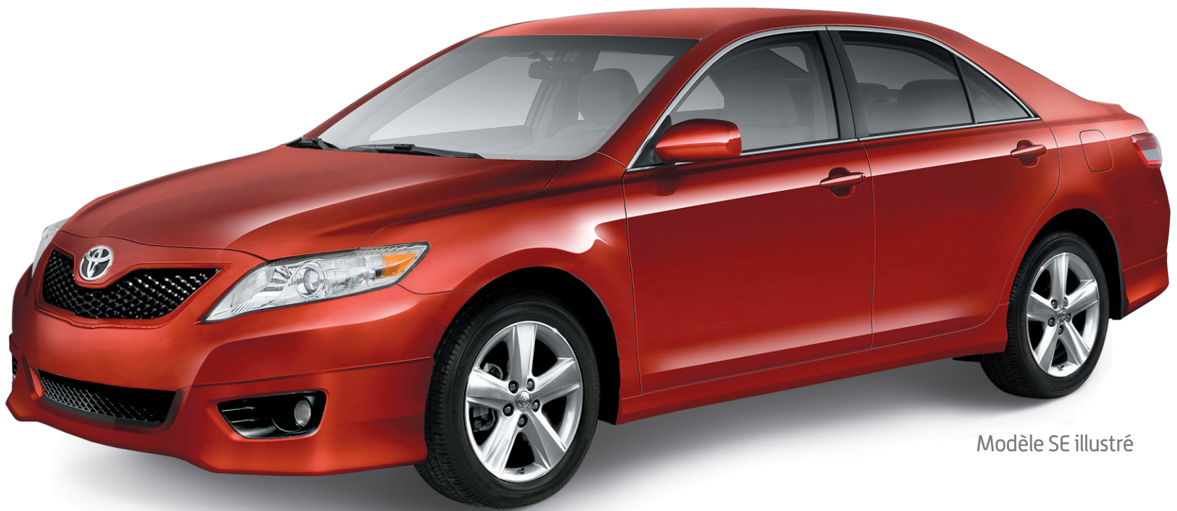
Modèle SE illustré

Profitez également de toutes nos autres offres avantageuses sur nos Toyota.