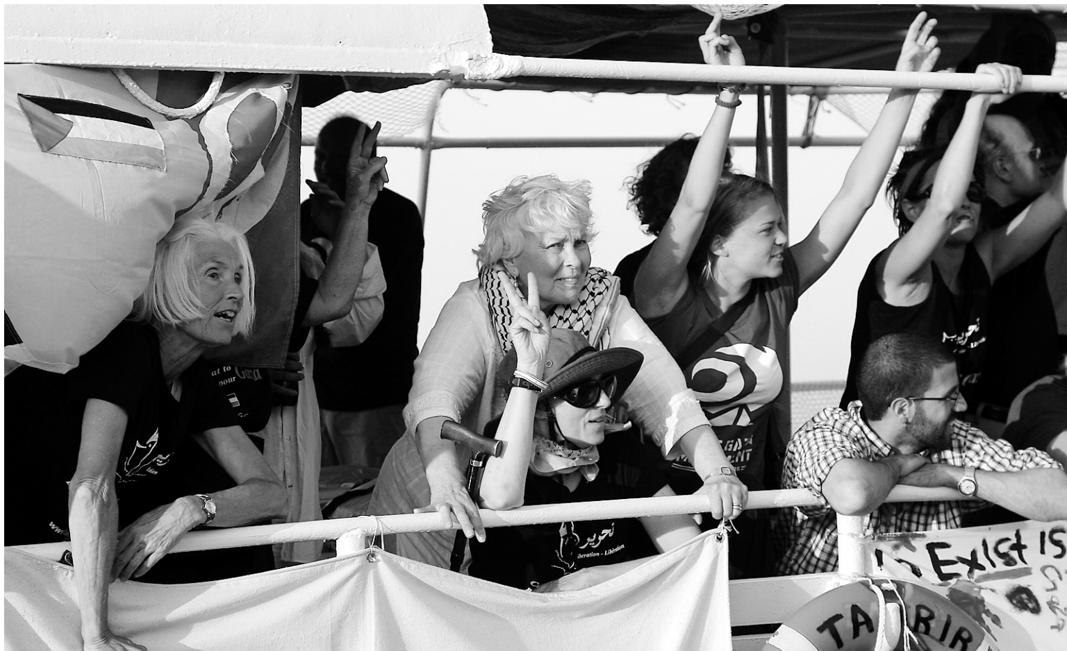
Des militants canadiens montent la garde sur le Tahrir pendant que le bateau se fait remorquer par les autorités grecques, hier au large de la Crète.

Une fois arraisonné, le Tahrir n'était cependant pas au bout de ses peines. Les passagers racontent que, en arrivant au quai, la garde côtière a laissé le bateau se heurter à un mur