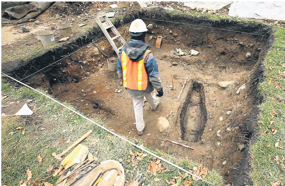
Des archéologues ont exhumé les ossements de 162 Montréalais qui étaient enterrés sous la place d'Armes, le square Dorchester et la place du Canada (notre photo).

Les travaux à la place d'Armes ont commencé en 2009. Des archéologues ont toutefois fait les premiers prélèvements