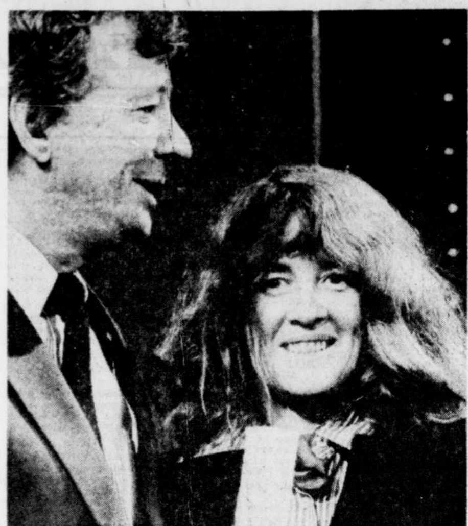
Les plus chaudes ovations ont été réservées, hier au Salon rouge, à Marie-Claire Blais et Roland Giguère.