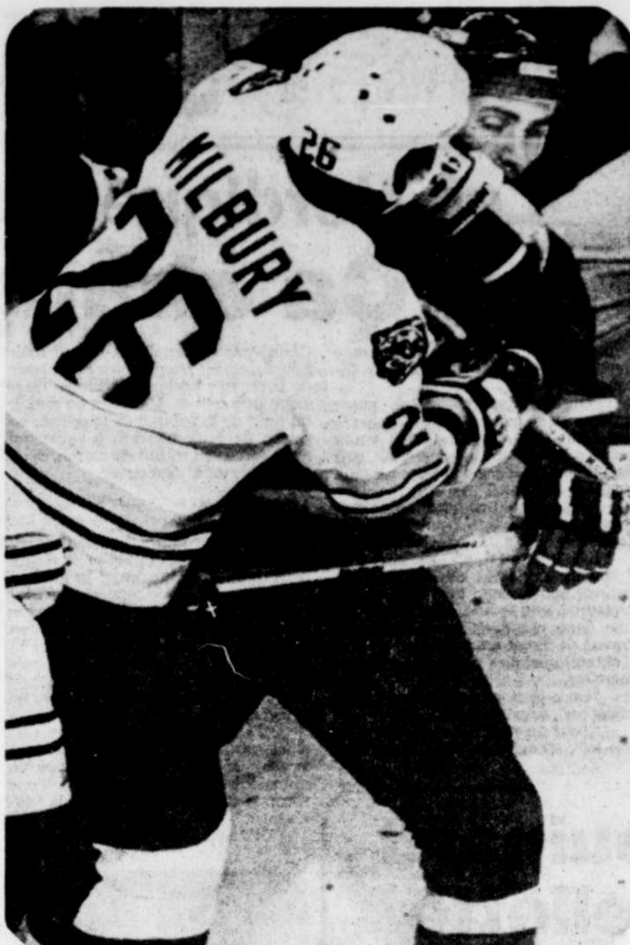
Comme s'est souvent son habitude, le défenseur Mike Milbury des Bruins de Boston s'est servi de son coude pour freiner l'élan de Brent Sutter des Islanders.

Pendant son séjour à Montréal, le Canadien ne pouvait l'envoyer à Halifax à cause des règlements de l'expansion.