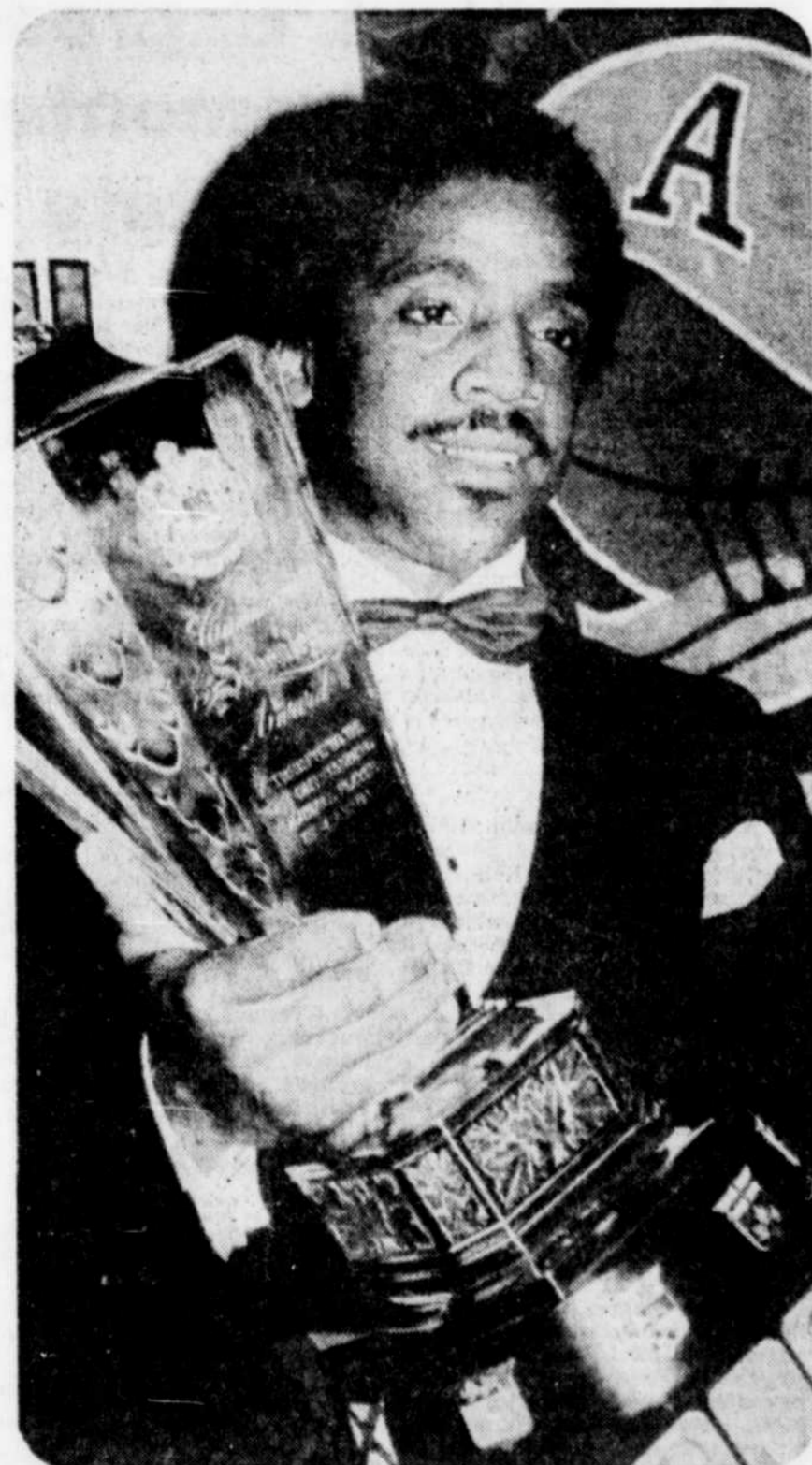
C'est avec émotion que Condredge Holloway a accepté, hier, l'un des trophées Schenley, à titre de meilleur joueur de la Ligue canadienne de football cette saison.