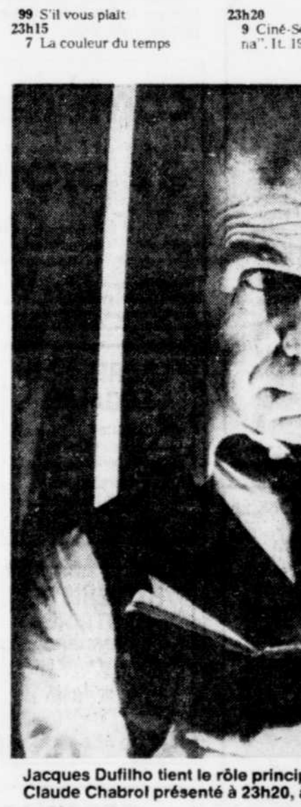
Jacques Dufilho tient le rôle principal dans "Le cheval d'orgueil", film de Claude Chabrol présenté à 23h20, à Radio-Canada.