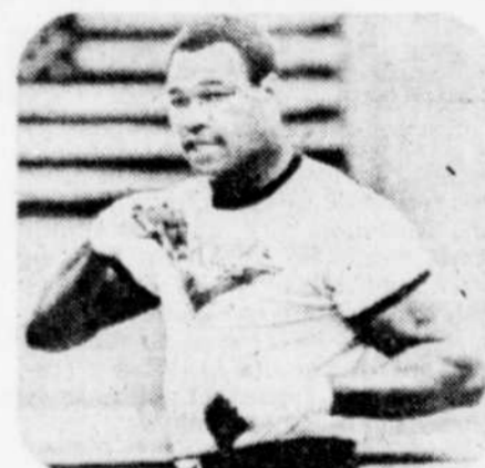
Larry Holmes est fin prêt pour son combat contre Randy Cobb.