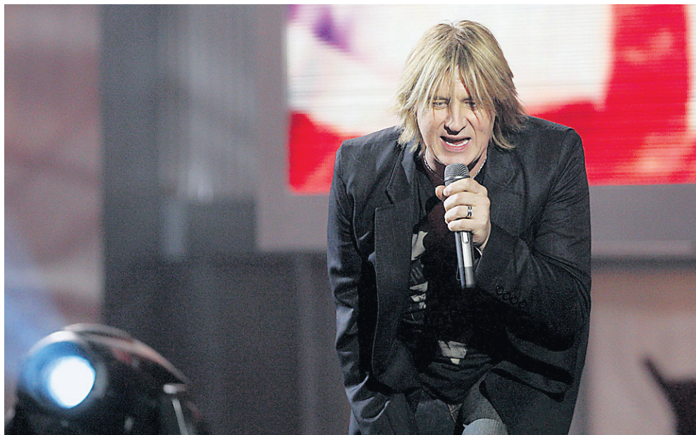
Le chanteur Joe Elliott du groupe Def Leppard.