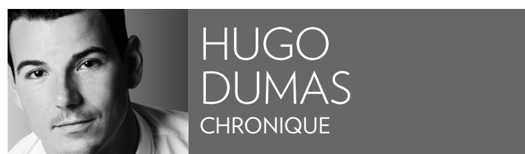
HUGO DUMAS CHRONIQUE

Gros dimanche de télévision en perspective: retour de Tout le monde en parle à Radio-Canada, début d' Occupation double 6 en République dominicaine et présentation d'une émission spéciale du Banquier à TVA sur les 100 ans du Canadien de Montréal. Muscliez vos pouces, les amis, ça va zapper dans nos chaumières.