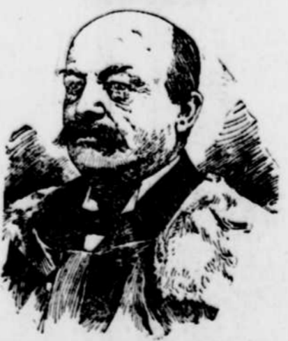
SIR ALEX. LACOSTE, juge en chef de la cour du Banc de la Reine.