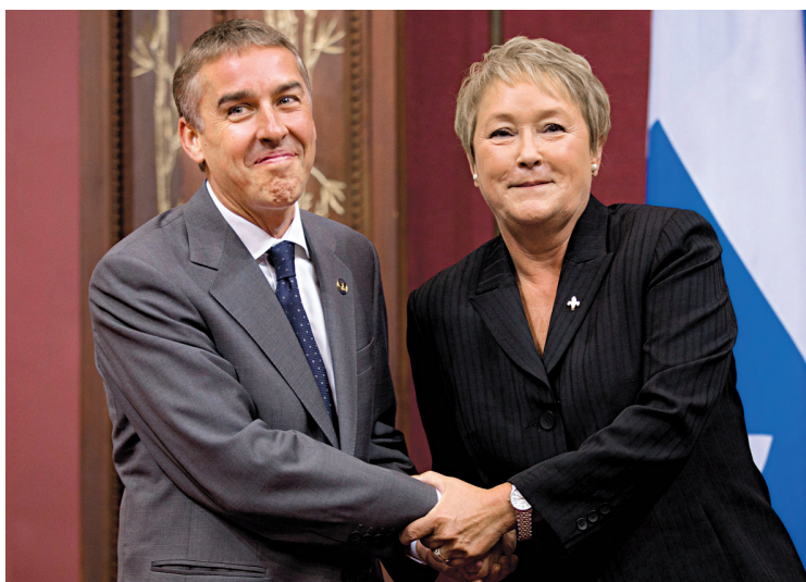
La première ministre Pauline Marois au moment de présenter son ministre des Finances, Nicolas Marceau.

CAHIER B • LE DEVOIR, LE JEUDI 20 SEPTEMBRE 2012