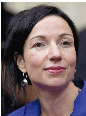
Martine Ouellet assumera la direction du ministère des Ressources naturelles.

L'ÉQUIPE ÉCONOMIQUE DU GOUVERNEMENT MAROIS