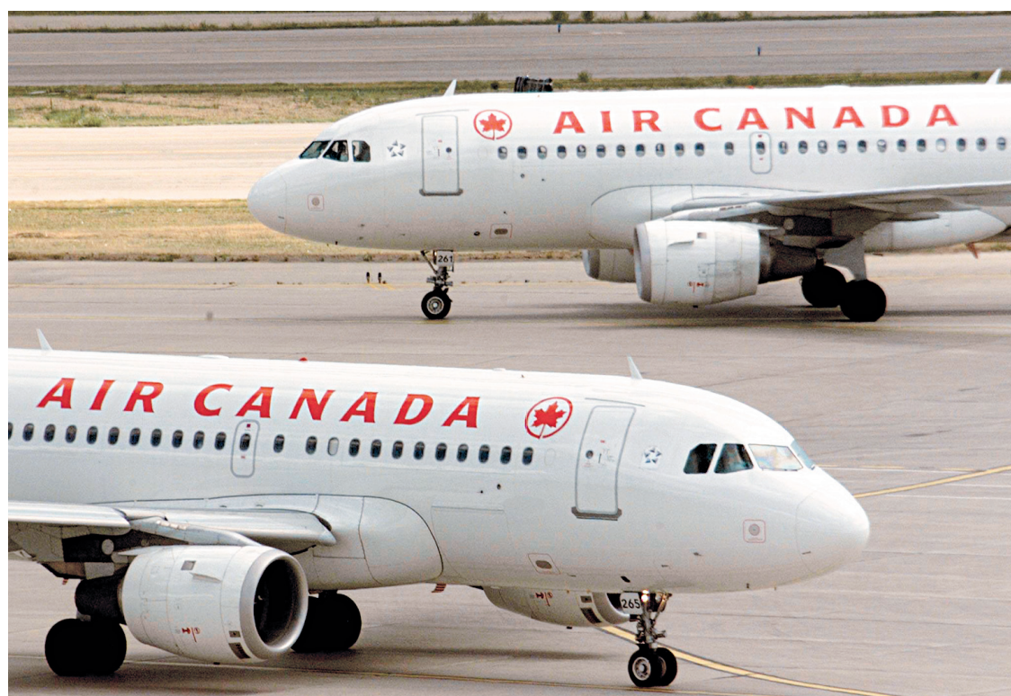
Le transporteur au rabais portera son nom propre même si la compagnie sera détenue exclusivement par Air Canada.

Le nouveau modèle de gestion permettra au transporteur à bas prix d'exploiter des destinations européennes qui ne sont actuellement pas rentables pour Air Canada, et il le rendra plus concurrentiel sur