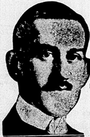
Candidat libéral dans Mercier