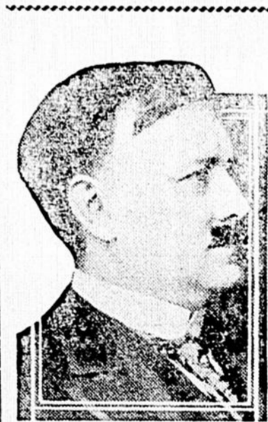
HON. HONORE MERCIER, Ministre des Terres et Forêts dans le Cabinet Taschereau