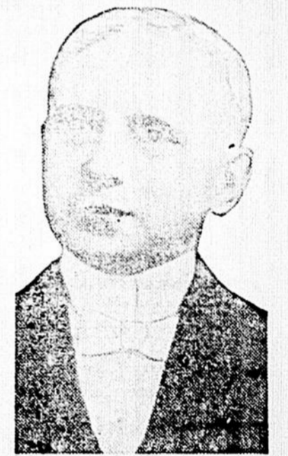
HON. HECTOR LAFERTE, Ministre de la Colonisation, de la chasse et des pêcheries dans le cabinet Taschereau.