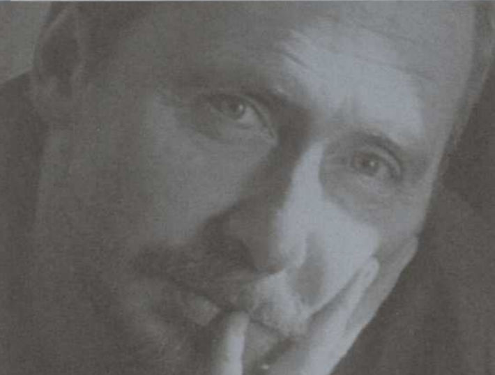
George F. Walker, auteur

L'Enfant-Problème est une des six pièces du cycle Motel de passage et a valu à son auteur le Prix Floyd S. Chalmers en 1998.