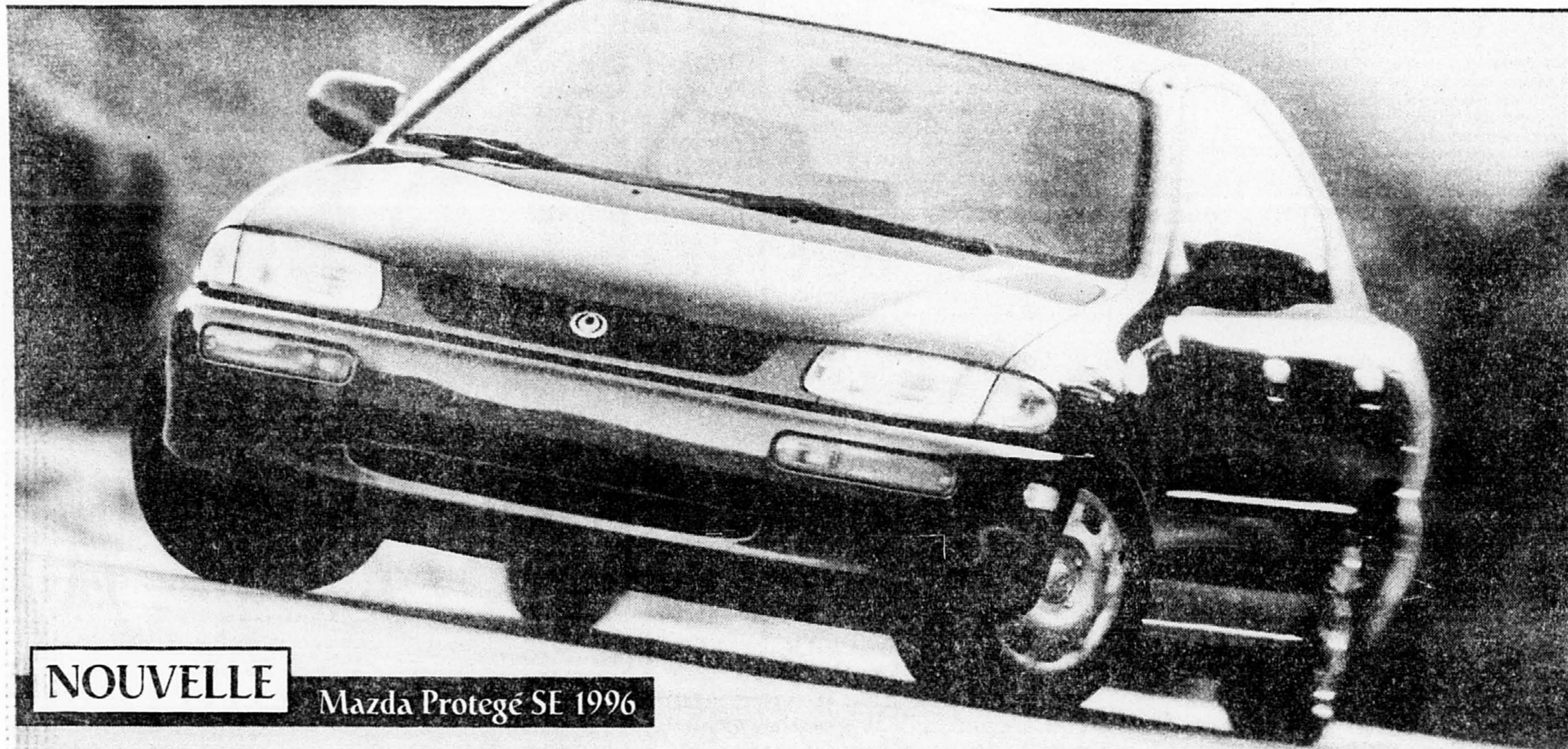
NOUVELLE Mazda Protegé SE 1996

Cité par l'agence SPA, le prince héritier de Bahreïn a « dénoncé l'explosion et affirmé son soutien au peuple saoudien frère ».