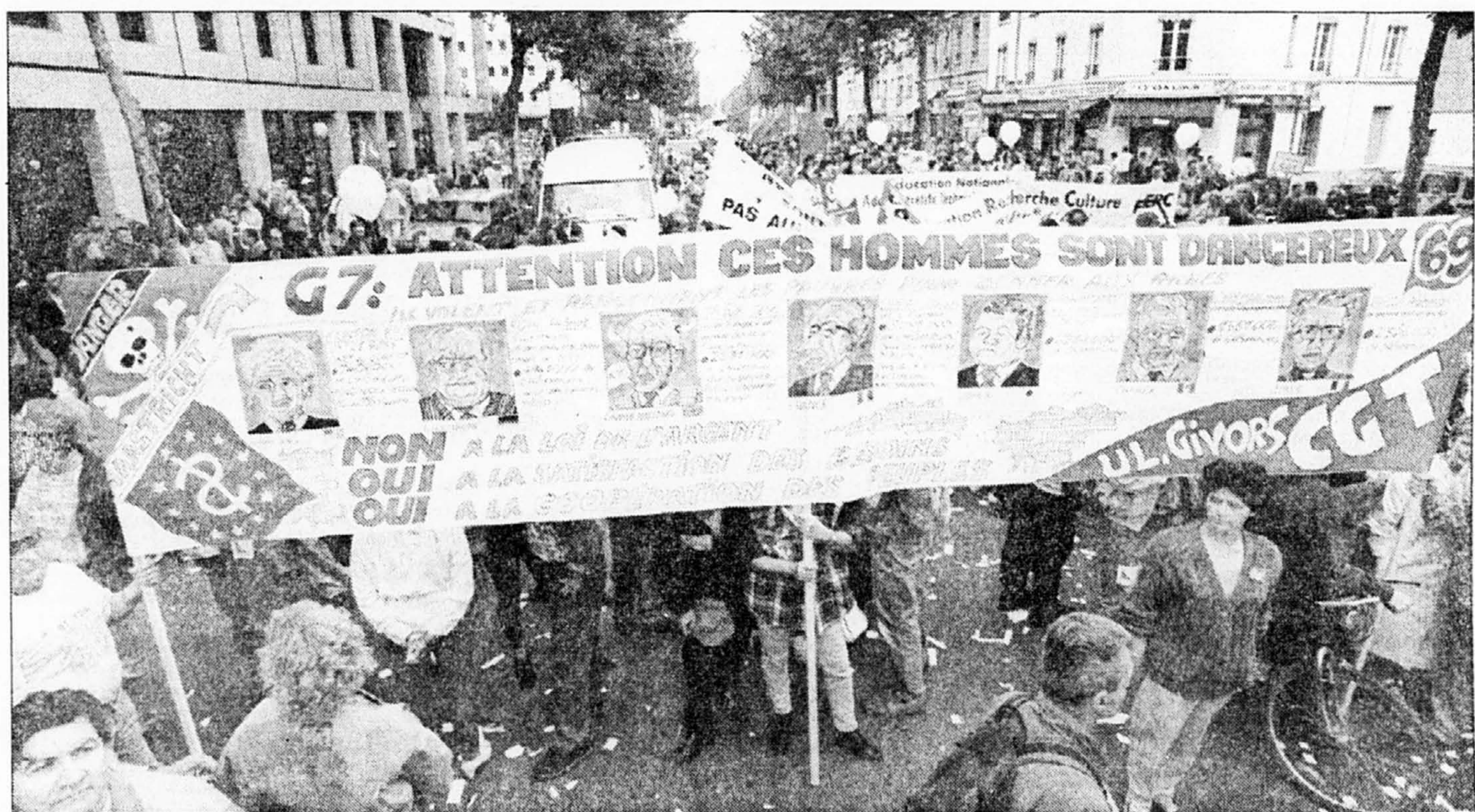
Vingt-cinq mille manifestants, selon la police — 50 000, selon les syndicats — ont défilé à Lyon hier pour protester contre des effets de la mondialisation de l'économie sur les populations des pays représentés aux assises du G7.

Parmi les nombreuses questions particulières ou bilatérales, le Canada entend soulever, discrètement, la question de l'amendement Helms-Burton qui pénalise les sociétés étrangères faisant affaire avec Cuba. « Nous ne voulons nullement embarrasser les Américains, dit un haut fonctionnaire canadien, mais plutôt leur faire comprendre que cette politique d'extra-territorialité nuit au commerce international... et à leurs propres intérêts. »