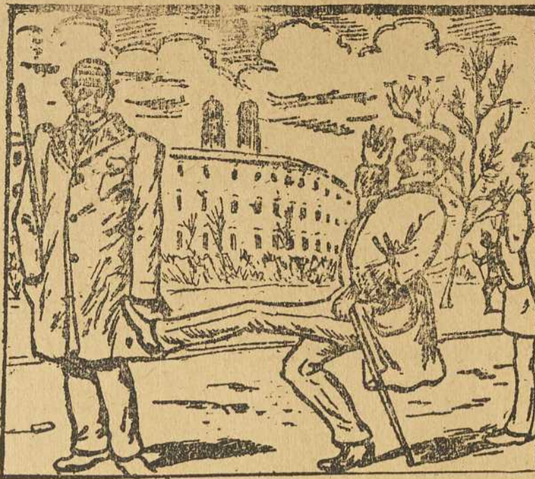
Cet homme cherche sa femme. Où est-elle?

Notre concours du mois de décembre est terminé. Les concurrents devront donc nous envoyer les 5 devinettes parues avec le coupon ci-dessous. Il sera alors attribué, par tirage au sort, 10 magnifiques gravures en couleurs. Adressez les réponses à SPHINX, le Samedi, 200, boulevard St-Laurent, Montréal. Le gagnant d'une prime diot nous la réclamer par lettre ou en personne, s'il est des environs. On peut envoyer autant de réponses à un concours qu'on envoie de coupons.