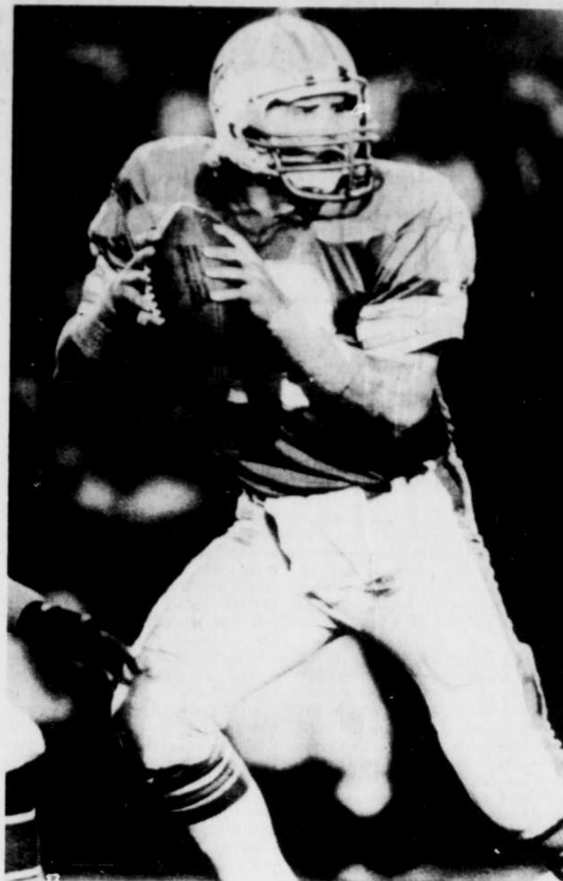
Une bonne année pour Dan Marino. Il ne lui manque plus qu'une victoire au Super Bowl.

Les Giants pourraient cependant réserver une surprise de mauvais goût aux Rams.