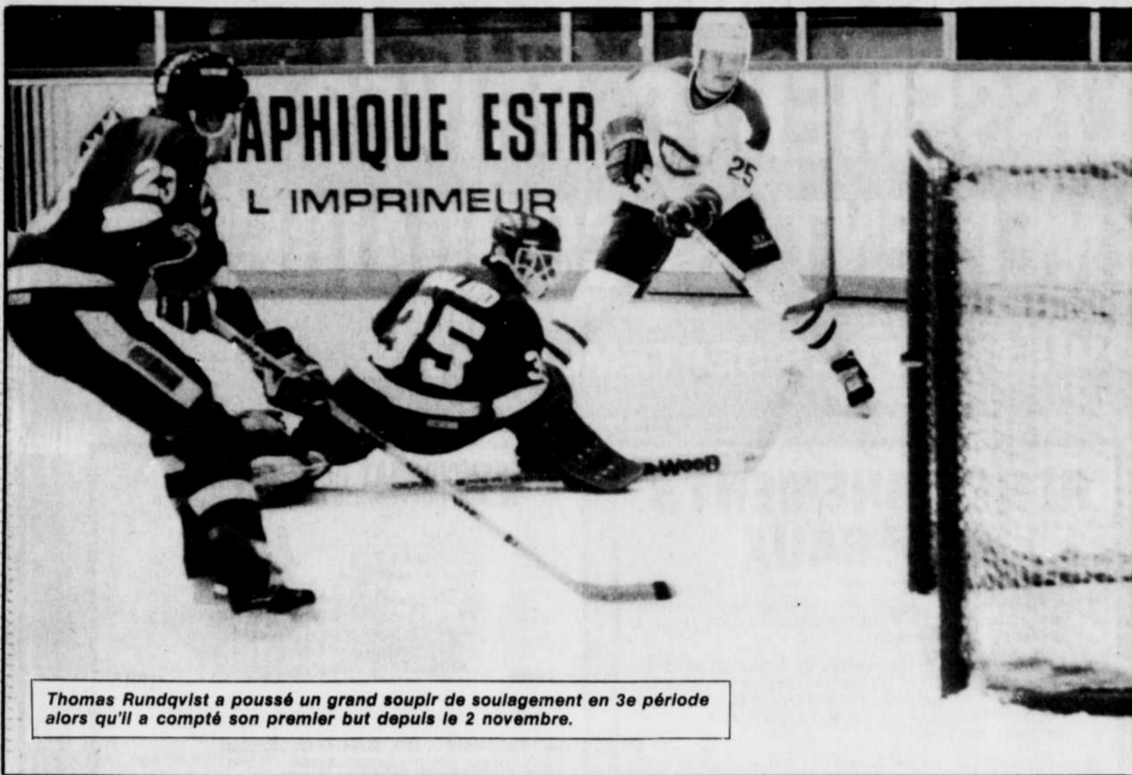
Thomas Rundqvist a poussé un grand soupir de soulagement en 3e période alors qu'il a compté son premier but depuis le 2 novembre.