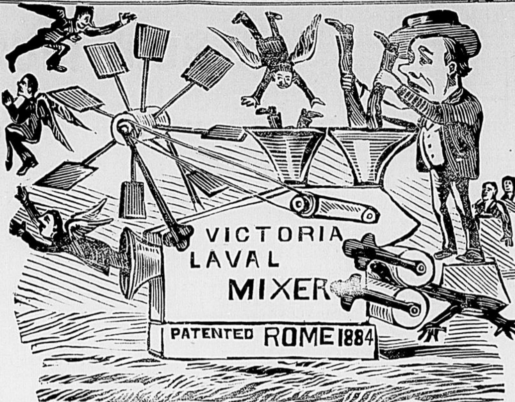
Une machine brevetée que l'on a oublié d'envoyer à l'exposition, une machine à faire des anges avec les professeurs de Laval et de Victoria, et de les aspirer ensuite.

Le meilleur, le plus exquis des cigares vendus à 5 cents, est le "DOCTOR." Essayez le.