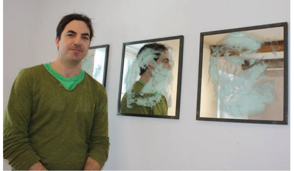
Télescopes en cours de production propose une série d'œuvres, dont les objets ont été ramassés çà et là.

Détenteur d'un baccalauréat en design graphique à l'UQAM, il participe à plusieurs expositions individuelles, entre autres, au centre Articule, à la Fonderie Darling et au