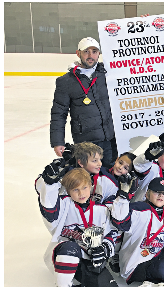
Les Faucons de Saint-Bruno ont remporté la bannière