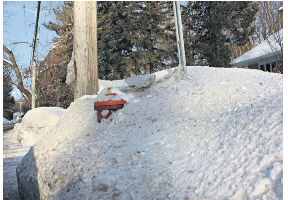
La photo qui accompagne ce texte a été prise le mercredi 10 janvier dernier en après-midi sur le chemin De La Rabastalière Est.

L'hiver 2017-2018 présente des caractéristiques d'une saison qui commence rudement. Jusqu'à présent, il y a eu au moins 80 cm de neige qui sont tombés sur Saint-Bruno-de-Montarville. Toute cette grande quantité a été précédée par un froid mordant qui a donné bien des maux de tête aux responsables des Travaux publics. D'ailleurs, le gel a causé 26 bris d'aqueduc dans des quartiers de Saint-Bruno-de-Montarville, comme le soulignaient Les