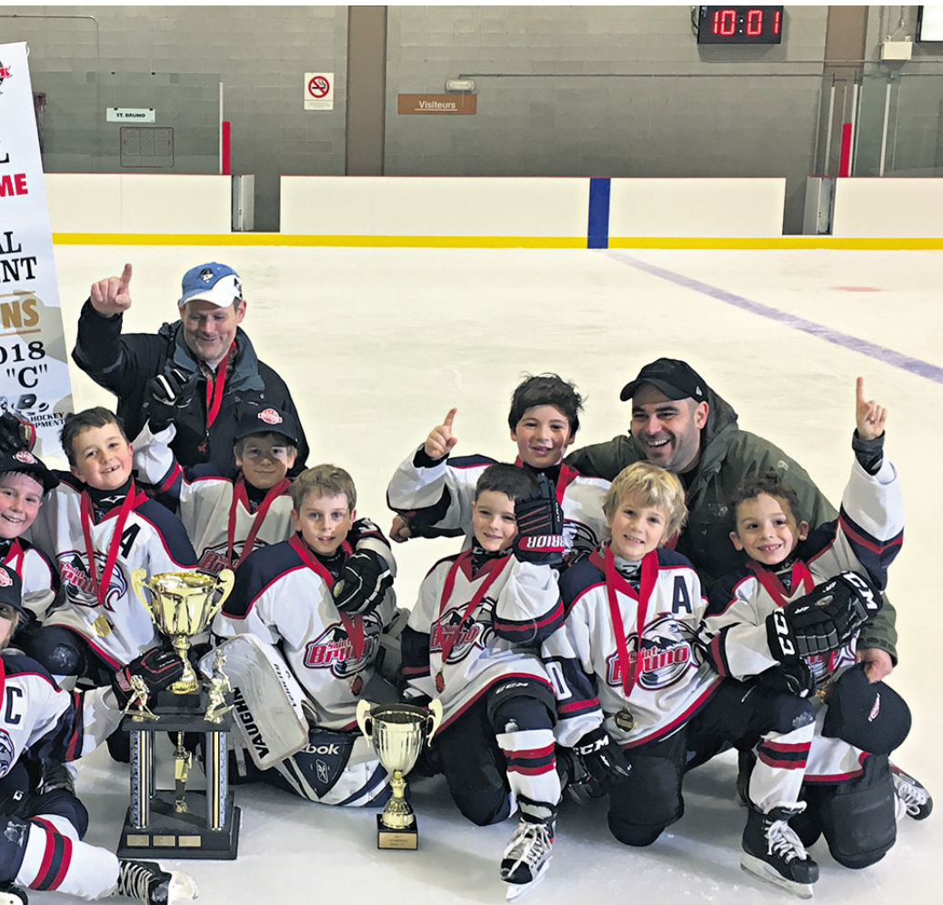
des champions novice C lors d'un tournoi à NDG.

Les rencontres du Tournoi de Notre-Dame-de-Grâce se déroulaient aux arénas Doug-Harvey et Bill-Durnan.