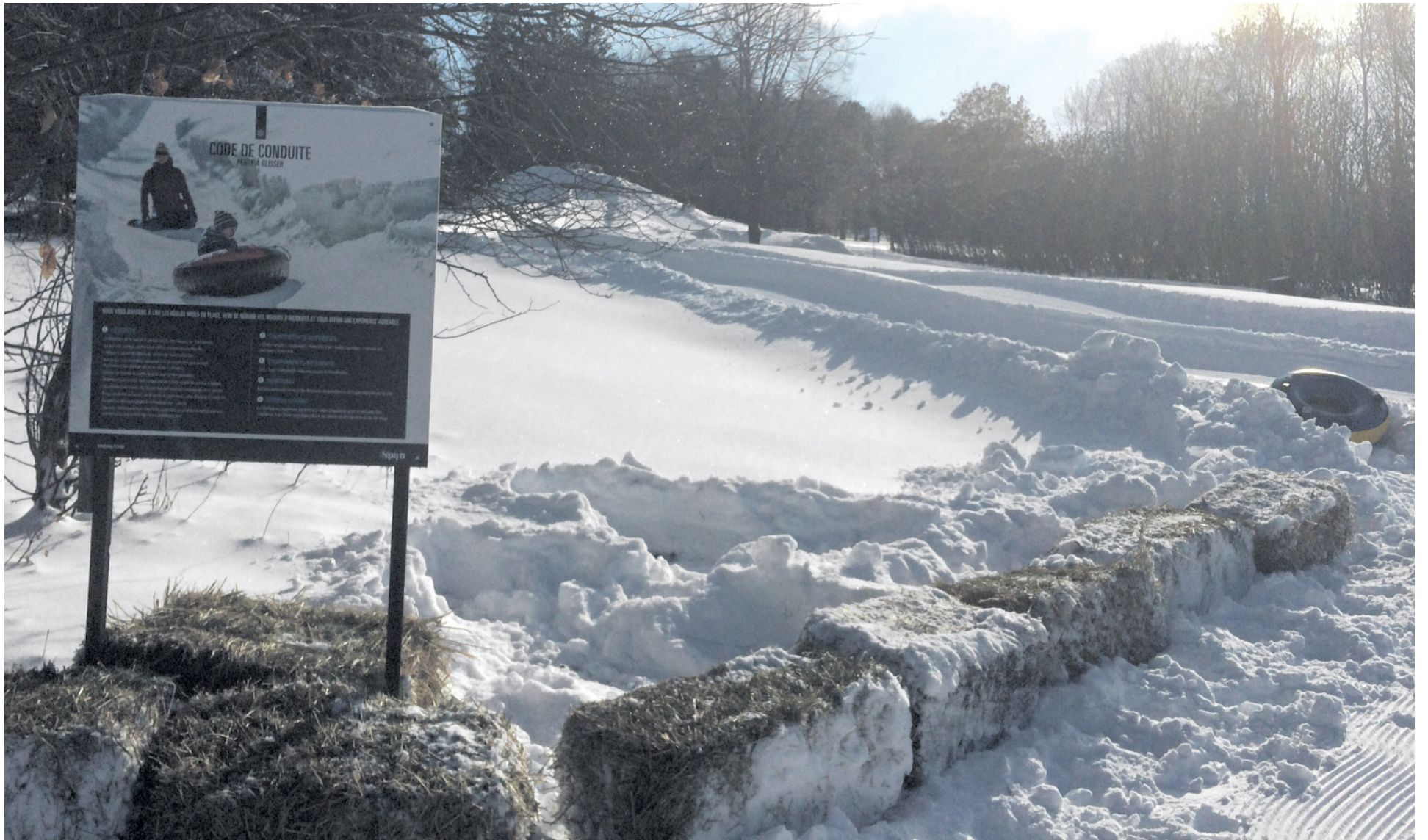
Le parc national du Mont-Saint-Bruno propose désormais une pente à glisser et une patinoire extérieure.

Le parc national du Mont-Saint-Bruno a mis en place, cet hiver, plusieurs activités pour diversifier l'offre de service à l'intérieur de ses murs au grand air.