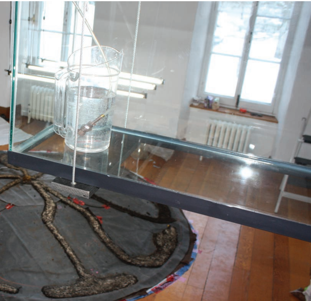
Thémis - À travers les nuages, sous les nuages.

Dans une cour à ferraille à Terrebonne, « j'ai commencé le corpus, relate l'artiste, avec l'industrie automobile dans un cimetière de voitures que j'ai érigées à la verticale sur une distance d'environ 25 mètres. C'est littéralement un domino de voitures qui tanguent. C'est l'effet de la conséquence de tout