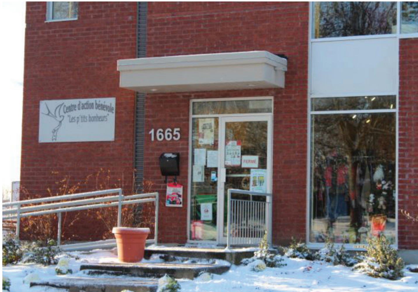
Pour 2018, les activités et les services se poursuivent et des échanges avec la Ville s'annoncent positifs.

Lors de l'assemblée ordinaire du conseil municipal du 4 décembre 2017, Hélène Guèvremont, directrice générale du CAB, a demandé à la Ville d'avoir accès aux locaux municipaux gratuitement. « Récemment, nous avons appris que des services à l'extérieur de Saint-Bruno ont accès gratuitement aux locaux municipaux pour leurs