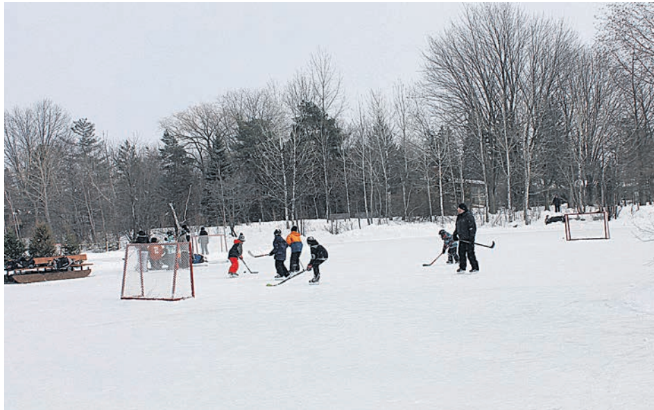
Tradition oblige, le dimanche fait place à plusieurs activités familiales.

Dès 18 h 30, la population sera attendue sur le site du lac du Village, où tous pourront entre autres se promener en carriole et