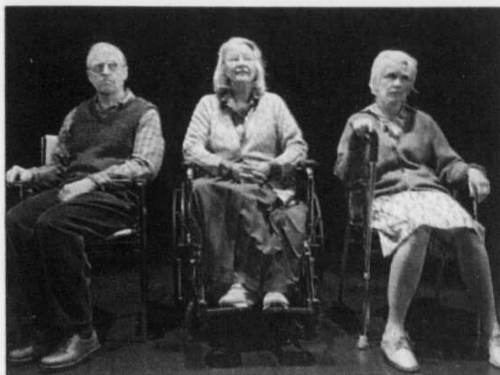
Dans Half Life, les rôles principaux sont interprétés avec sobriété et naturel.

La pièce commence par la rencontre entre deux quadragénaires, Anna et Reynolds, qui se retrouvent dans la salle d'attente de la résidence; ils sont tous deux divorcés et seuls. On pourrait s'attendre à ce qu'une idylle naisse entre eux, d'autant plus que leurs premiers échanges sont assez piquants. C'est compter sans l'art et la ruse du dramaturge, qui va donner une orientation inattendue à sa pièce. Clara, la mère d'Anna, habite la résidence depuis un certain temps; quant à Patrick, le père de Reynolds, il vient d'être installé. Clara et Patrick, qui ont tous les deux plus de quatre-vingts ans, ont été placés sur le même étage; ils commencent par se rencontrer en se croyant étrangers l'un à l'autre; puis ils se rendent bientôt compte qu'ils se sont connus et aimés dans leur jeunesse, avant la guerre. Le lien qui se tisse de nouveau entre eux va bientôt causer des remous au sein du personnel de la résidence.