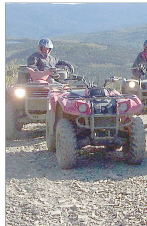
Fredericton vient d'approuver différentes modifications aux véhicules hors route.