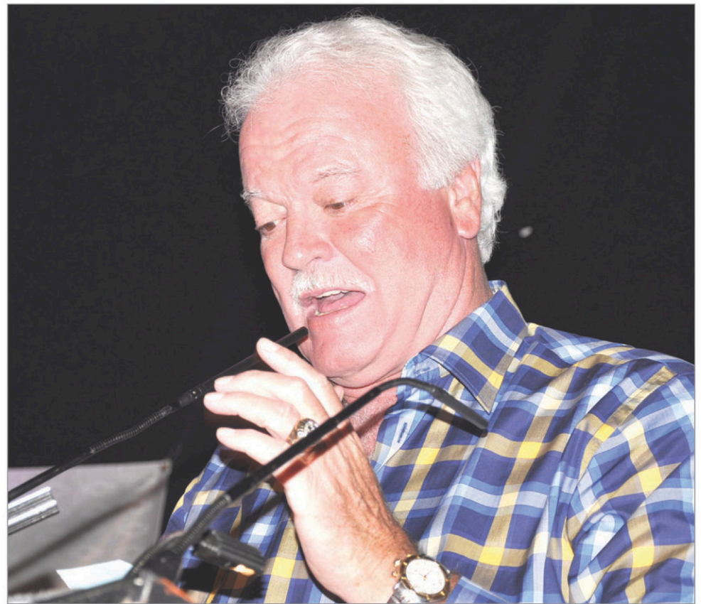
L'invité spécial est Yvon Lambert, un ancien joueur des Canadiens de Montréal et détenteur de quatre bagues de la coupe Stanley.

Contactez-nous en toute confidentialité alain.lavoie@quebecormedia.com