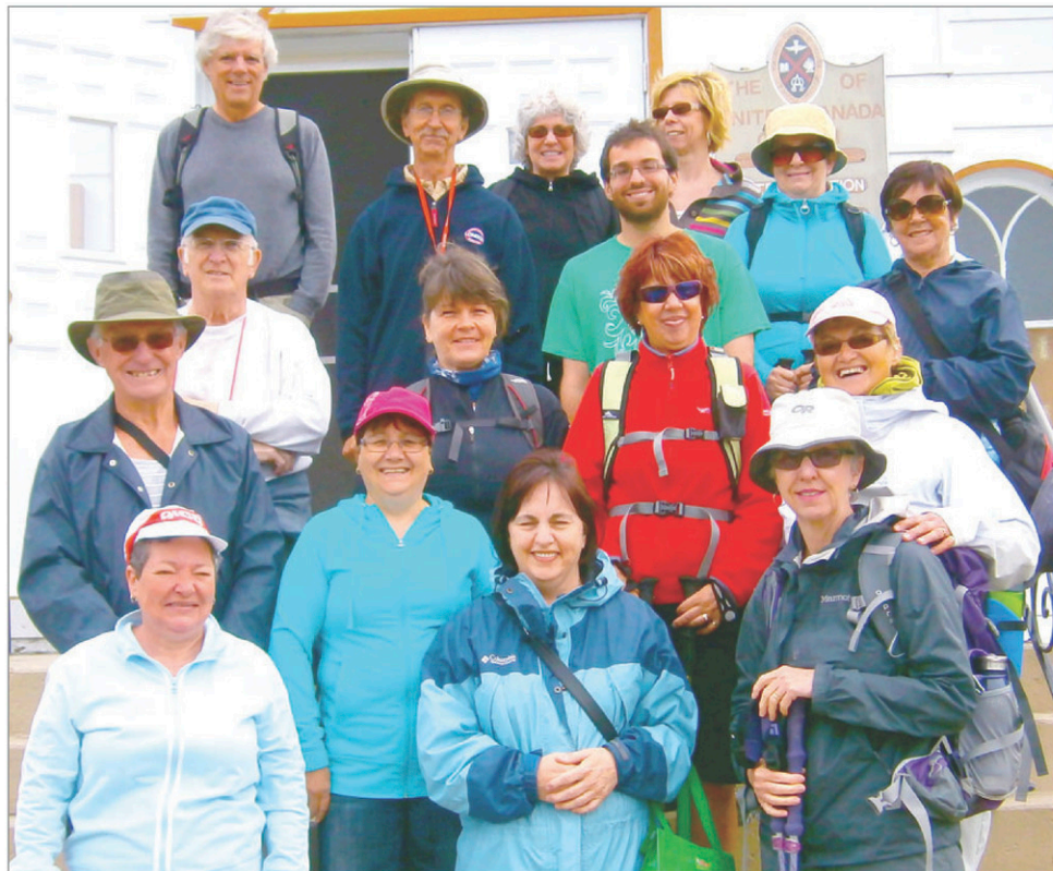
Le comité organisateur de cette belle marche dans un chemin « historique » pour notre région. PHOTO COURTOISIE

Pour des informations, consultez heritagecheminkempt.com ou le groupe Facebook Marche historique du chemin Kempt. (Source : Daniel Charest)