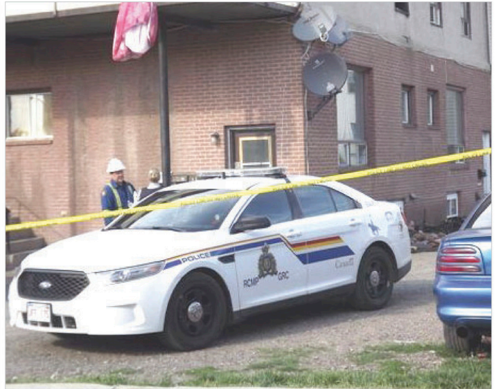
La GRC a arrêté une femme de Campbellton dans le cadre d'une enquête sur un incendie criminel qui a endommagé un immeuble d'habitation.