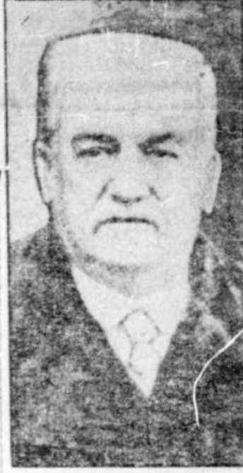
M. Eugène Etienne, ministre de la Guerre, en France, qui vient de présenter le projet de loi demandant le rétablissement du service militaire de trois ans.

Fishkill, N. Y., 27. — Harry Thaw, le meurtrier de Stanford White, a refusé de rendre témoignage devant la commission Suizer. Cette commission fait une enquête sur la prétendue conspiration découverte récemment et dont le but était de faire rendre la liberté à Thaw, en corrompant le directeur de l'Asile des fous criminels de Matteawan. Thaw a déclaré qu'il rendrait témoignage, mais à la condition qu'il ne fût pas traité comme un fou, par les commissaires-enquêteurs.