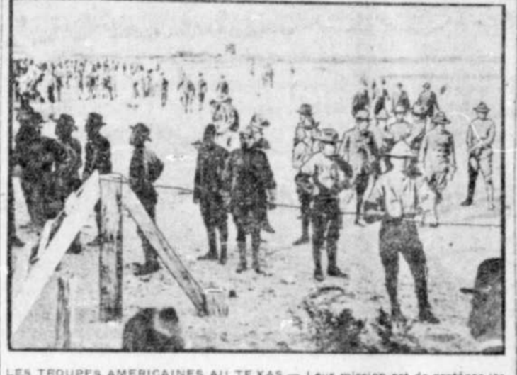
LES TROUPES AMERICAINES AU TEXAS — Leur mission est de protéger les citoyens des Etats-Unis, le long de la frontière, où rôdent des bandes de rebelles mexicains.

Mexico, 27.—Le président provisoire espère que bientôt la république mexicaine jouira des bienfaits de la paix. Les révolutionnaires du nord et du sud reviennent sur le point de se soumettre. Le général Emiliano Zapata paraît vouloir s'opposer aux projets de la nouvelle administration, mais plusieurs de ses lieutenants acceptent