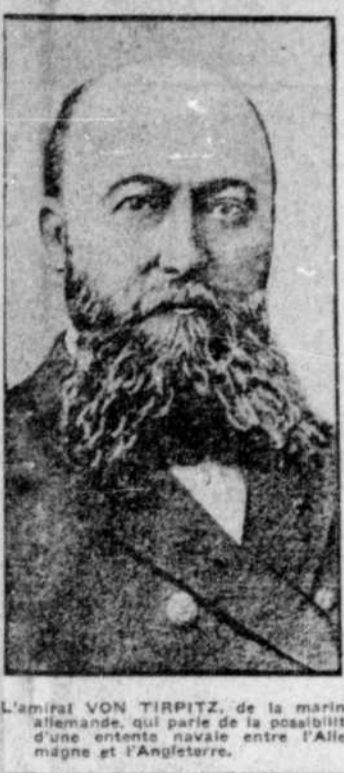
L'amiral VON TIRPITZ, de la marine allemande, qui parle de la possibilité d'une entente navale entre l'Allemagne et l'Angleterre.