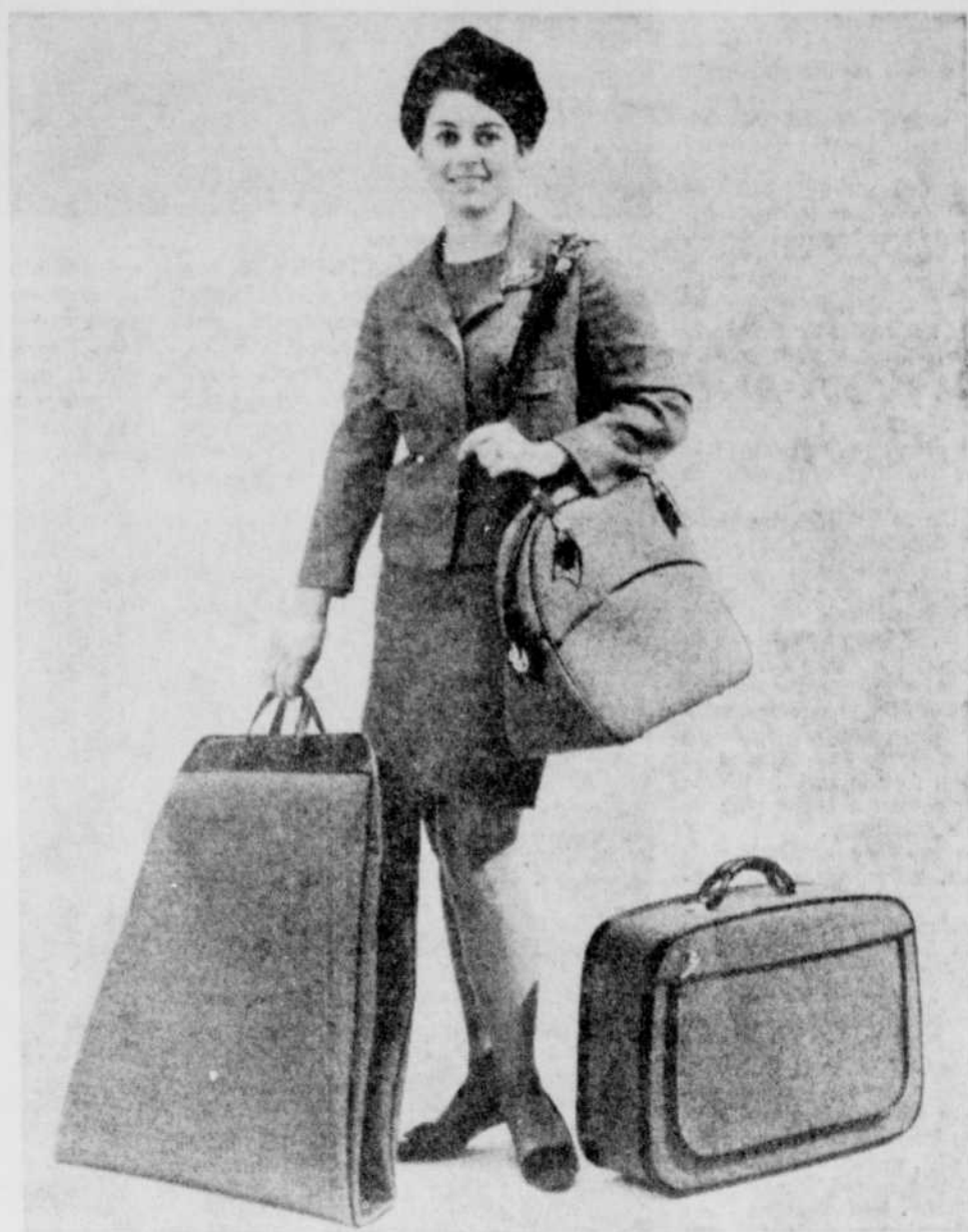
BON VOYAGE: Quelle jeune femme ne serait ravie de recevoir en cadeau de nocces, ces élégantes valises de fabrication canadienne en nylon catonique, deux tons. Bien pratique, avec ses cour-

Le mémoire recommande également que les femmes puissent être membres de jury au même titre que les hommes.