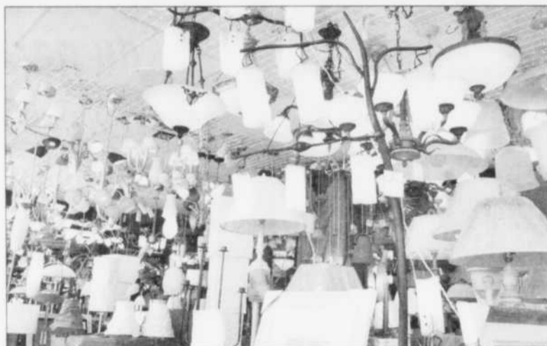
LUMIERE - Les nouvelles venues en matière d'éclairage s'appellent ampoules à halogène, ampoules économisant l'énergie, ampoules longue durée et fluorescents compacts.

Les ampoules standards les plus courantes, de 60 et 100 watts, ont comme principaux avantages d'être très peu coûteuses, facile à remplacer et d'un éclairage agréable. Elles ont par contre un rendement lumineux médiocre. À cause même de leur principe de fonctionnement, elles produisent beaucoup de chaleur et peu de lumière. En effet, une ampoule de 100 watts convertit environ 10 watts d'électricité en lumière et les 90 autres watts se convertissent directement en