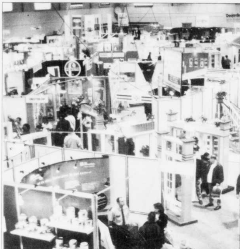
EXPO HABITAT - La 17 e édition du salon Expo Habitat se tiendra du 28 février au 3 mars, au Pavillon sportif de l'UQAC où plus d'une centaine d'Exposants se feront un plaisir de présenter les dernières nouveautés en matière de construction, rénovation et décoration.

Pour Daniel Dubois, directeur général de l'APCHQ, cette maison entièrement décorée et meublée représente l'attraction principale de la 17 e édition. « Cette promotion a toujours fait le succès de l'événement et c'est avec plaisir que nous offrons à nouveau aux visiteurs la possibilité de gagner cette demeure » explique-t-il.