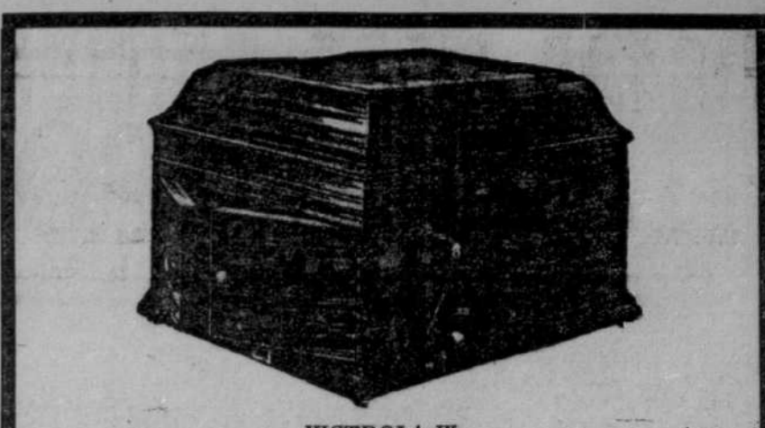
VICTROLA IX Acajou ou chêne, $65

Madrid, 19. — S'il faut en croire un article publié dans "l'Imparcial", l'Espagne devra s'abstenir de prendre part au conflit du Mexique. Le journal en question dit qu'il appartient aux Etats-Unis seuls de résoudre le problème.