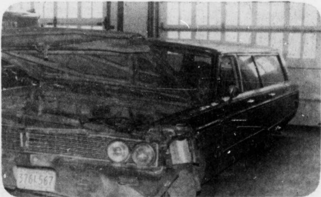
L'automobile volée appartenait à M. Michel Rossignol de Montréal. Trois véhicules étaient impliqués. (Photo Pépin).

Une exposition canine expressément pour les jeunes! Le Carrefour des Bois-Francs organisait vendredi cette activité pour plaire aux jeunes amateurs qui n'ont pas l'expérience des grandes expositions. Sur cette photo, la petite Patricia Pépin avec Katou. A qui ressemble cet enfant? (Photo Pépin).