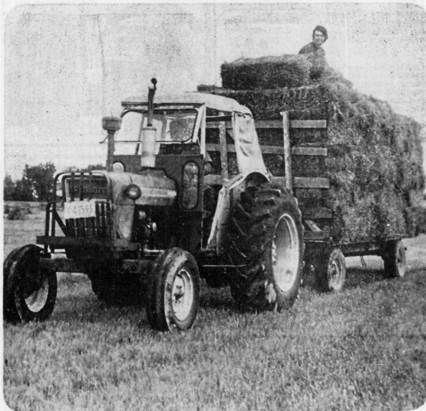
Le chargement est terminé et on rentre à la grande. S'il n'est pas trop mûr, la qualité sera bonne. Et surtout, s'il n'est pas resté trop longtemps sur le sol à la pluie, le goût en sera meilleur

heures de plus, avec les risques de pluie que cela comporte. Mais dit-on, il peut supporter une bonne pluie sans dommages.