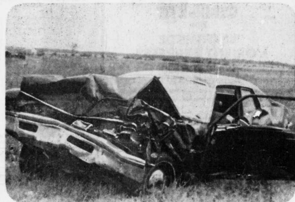
Un citoyen de Giffard a perdu la vie et son compagnon a été grièvement blessé. L'accident est survenu à 5 h hier matin, sur la route 20, à la hauteur de Daveluyville. Le conducteur se serait endormi avant d'aller s'arrêter à plusieurs pieds dans un ruisseau.

coordonnateur à l'oeuvre dans le milieu pour superviser la tâche des comités d'action sociale.