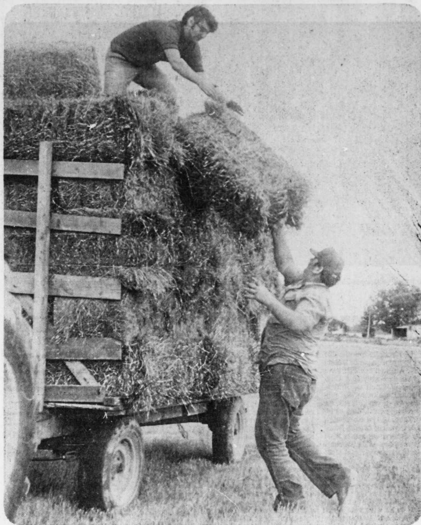
Coupé un jour et généralement mis en balle sur le champ le lendemain, le foin est en principe entreposé aussitôt. Certains préfèrent le mettre en quintoux et le laisser au soleil quelques

heures de plus, avec les risques de pluie que cela comporte. Mais dit-on, il peut supporter une bonne pluie sans dommages.