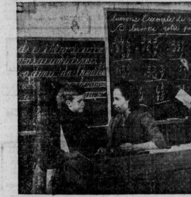
On ne saurait trop dire le mérite de l'institutrice rurale qui se dépense sans compter, et dans bien des cas, presque sans rémunération. D'autant plus qu'elle travaille souvent dans des conditions déplorables. Parfois il lui faut voir elle-même au nettoyage de l'école, chauffer la fournaise en hiver, etc. Rôle ingrat que celui d'enseigner à cette marmaille qui n'est pas toujours aussi sage que durant la visite de monsieur l'inspecteur. La présente photo est extraite d'un documentaire de l'Office national du film, Conte de mon village , où l'on voit à l'oeuvre l'institutrice d'une petite école qui pourrait être n'importe laquelle d'une paroisse du Québec.