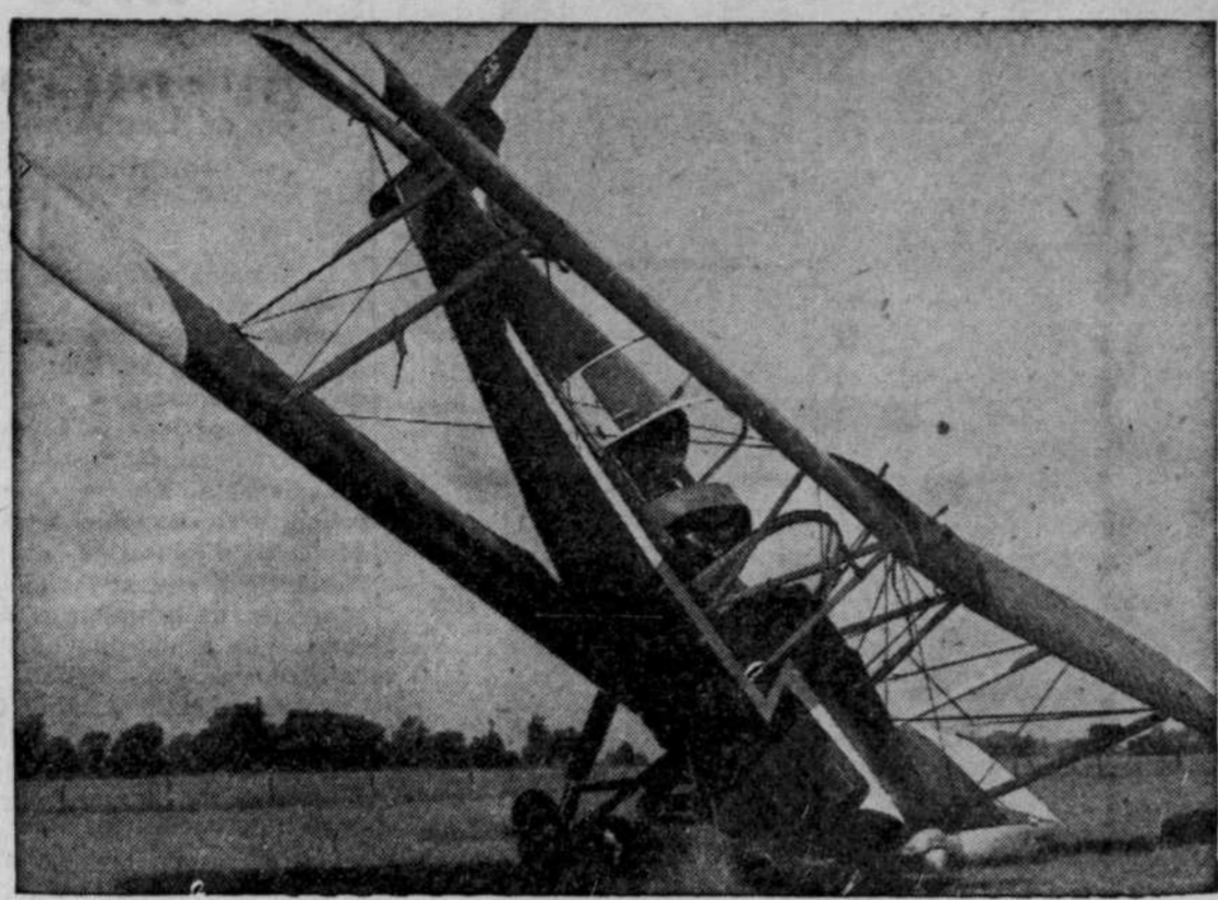
Comme dans le cas d'une vulgaire automobile, il n'a fallu que l'éclatement d'un pneu pour entraîner le dérapage de cet avion et son écrasement sur le nez, au moment de son décollage d'un aéroport voisin de Toronto. Le pilote peut s'en considérer chanceux d'avoir pu éviter un incendie de son moteur, surtout avec un appareil aussi ancien, car il y a belle lurette que les biplans ne sont plus de mode dans l'aviation civile.