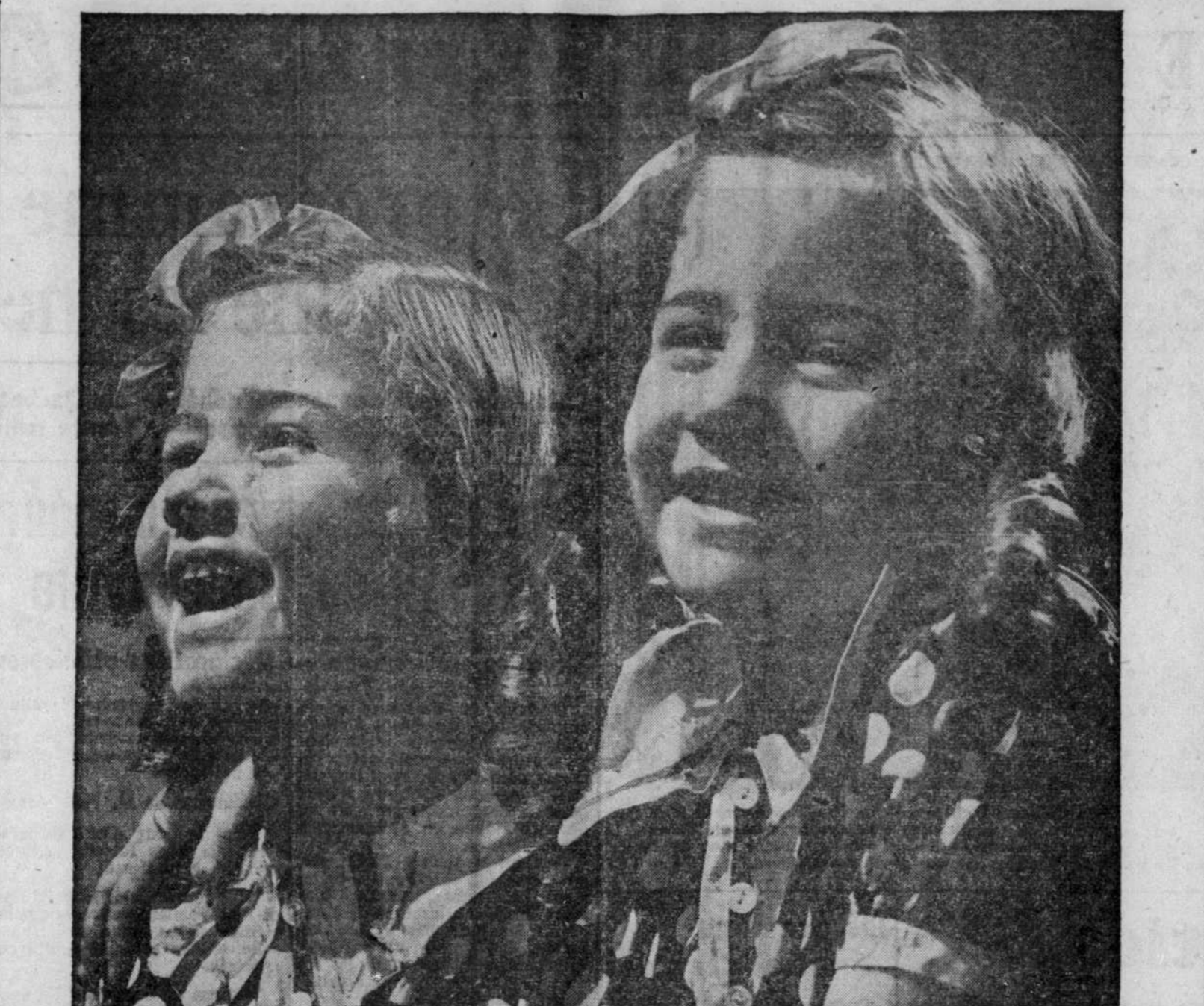
Les vacances sont bien finies! Des centaines d'enfants ont profité encore cet été des plaisirs et des bienfaits de la campagne grâce aux camps d'été subventionnés par la charité de chacun. Seule, la limite des ressources financières en empêche un plus grand nombre de jouir de ces avantages. Pensez-y, à l'occasion!