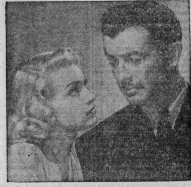
Robert Taylor et Lana Turner forment un couple étrange dans "Johnny Log Cabin" (version française de Johnny Eager) qui présentera le Champlain à partir de samedi, en exclusivité.