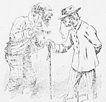
—La charité, s. v. p. —Jamais, p. p. c.