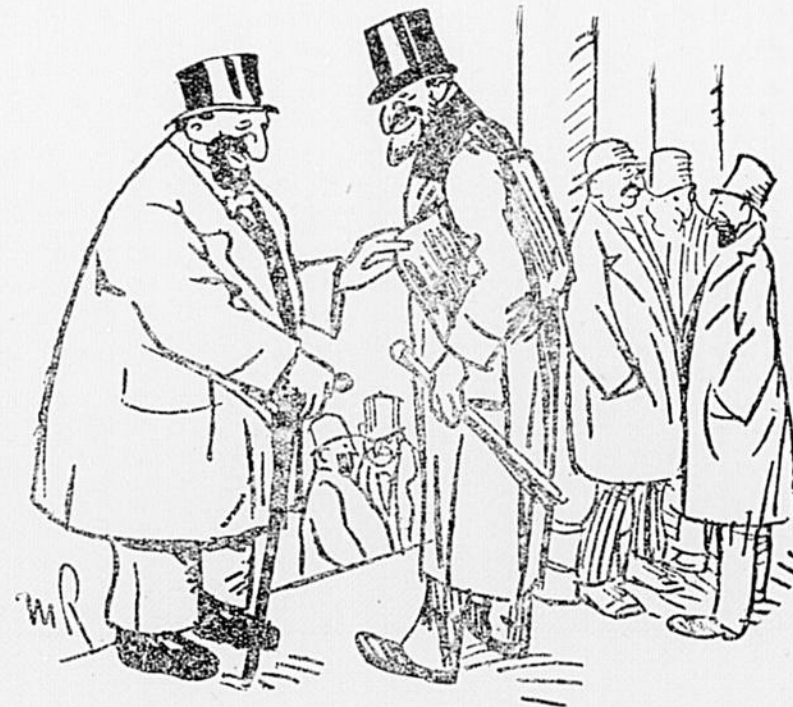
Au Palais de Justice : Il n'en est pas des opinions comme des vêtements : Plus on change et plus on semble malpropre.

Les sous-agents sont de braves gens. Celui-là se met à rire avec bienveillance.