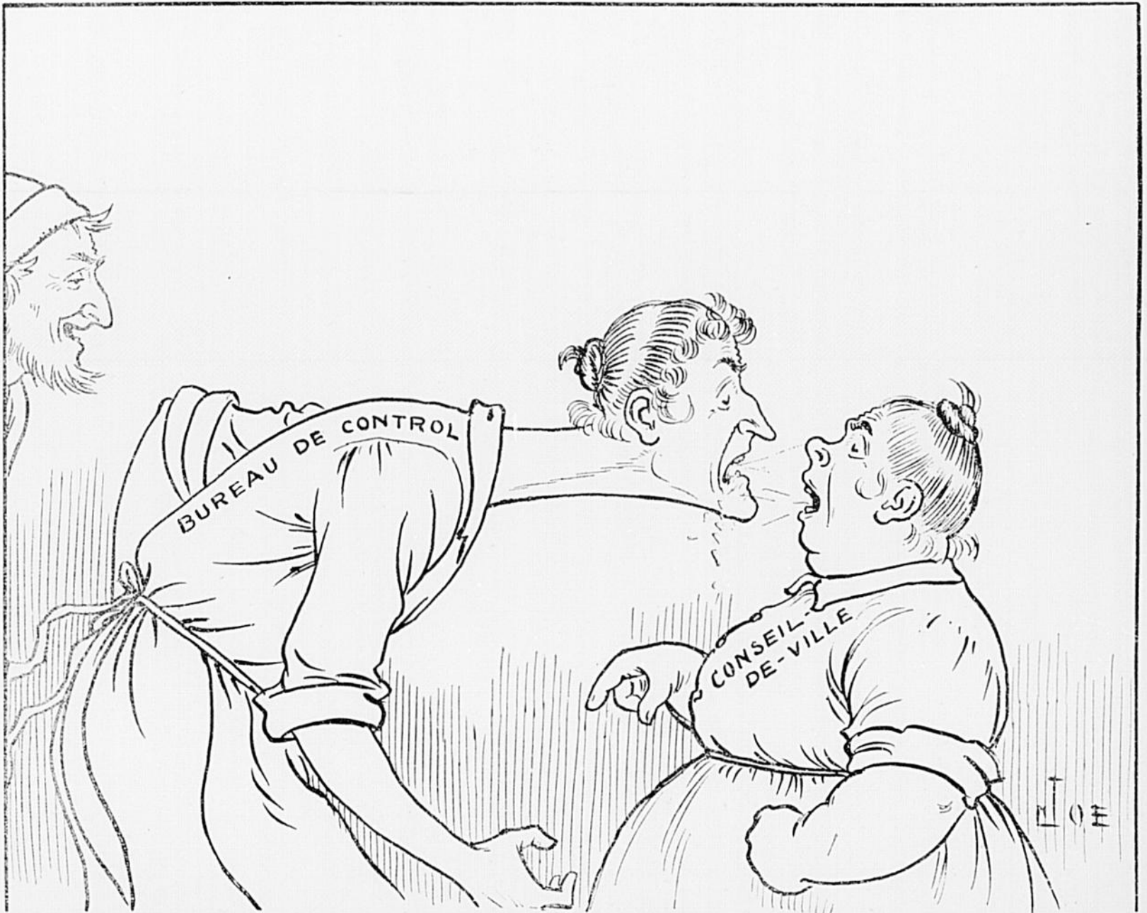
Ladébauche. — Hé, vous autres, quand est-ce que c'est que vous aurez fini de vous chamailler ? Décidément il y en a une de trop dans la maison.