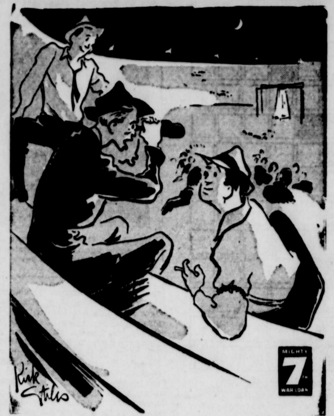
"Gilhooley manque de la gauche, touche de la droite le menton de Jones. Celui-ci chambranie et tous deux sont par-dessus les câbles."