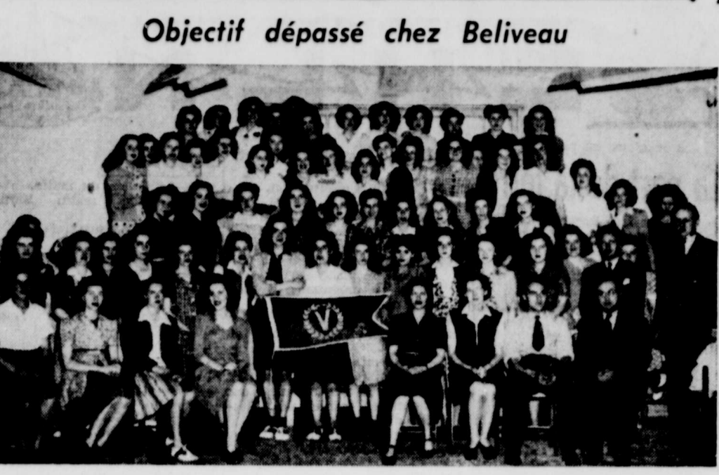
La manufacture Beliveau, du Cap-de-la-Madeleine, a souscrit dans la proportion de 126 pour cent de son objectif dans la campagne du VIII emprunt de la Victoire. Cet objectif était de $3,850.