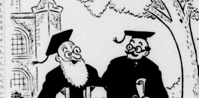
"J'ai enseigné le français dix-sept ans durant, et je m'en foute comme de ma première culotte."