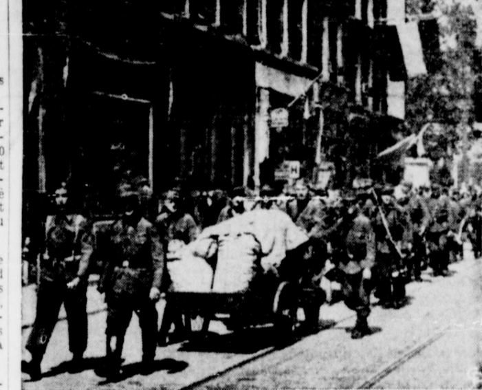
Les troupes allemandes continuent à se rendre partout en Europe. Cette photo a été prise à Rotterdam, où Canadiens et Britanniques conduisent les Boches aux magasins militaires. Les Allemands y remettent leurs armes et leur équipement aux Alliés.