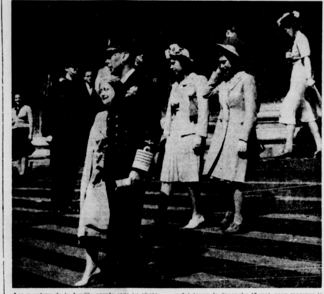
Les membres de la famille royale sont ici photographiés alors qu'ils quittent la cathédrale Saint-Paul, à Londres, après la cérémonie religieuse qui fut tenue, le dimanche 13 mai, pour marquer la victoire sur l'Allemagne.