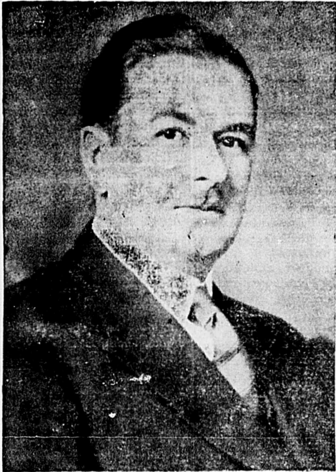
L'Honorable Maurice L. DUPLESSIS

On peut voir par la longue liste de réalisations de DUPLESSIS dans le domaine du travail, en quatre ans d'administration, l'intérêt constant que porte le premier ministre à l'ouvrier du Québec. Sécurité syndicale, augmentation de salaires, meilleures conditions de travail, voilà les trois principales réalisations de ce grand chef en qui l'ouvrier reconnaît UN AMI sincère, loyal et dévoué.