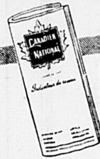
Le livre bleu, l'horaire du Canadien National, est le guide qui mène partout au Canada.

L'International LIMITÉ dont l'horaire figure au LIVRE BLEU des chemins de fer canadiens