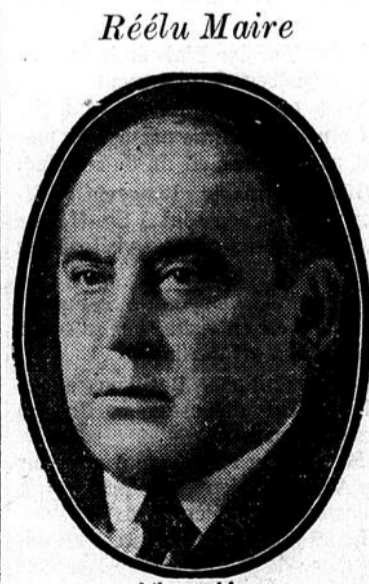
M. Damien BOUCHARD, chef parlementaire de l'Opposition, qui vient d'être réélu par acclamation, maire de St-Hyacinthe.

L'hon. M. Duplessis se rendra à Amos, le 10 du mois d'août, à l'occasion de la célébration du 25e anniversaire de cette ville abitibienne.