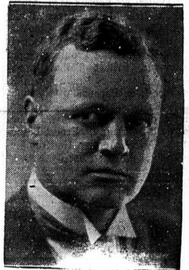
L'hon. R. J. Manion que le parti conservateur s'est choisi comme chef.