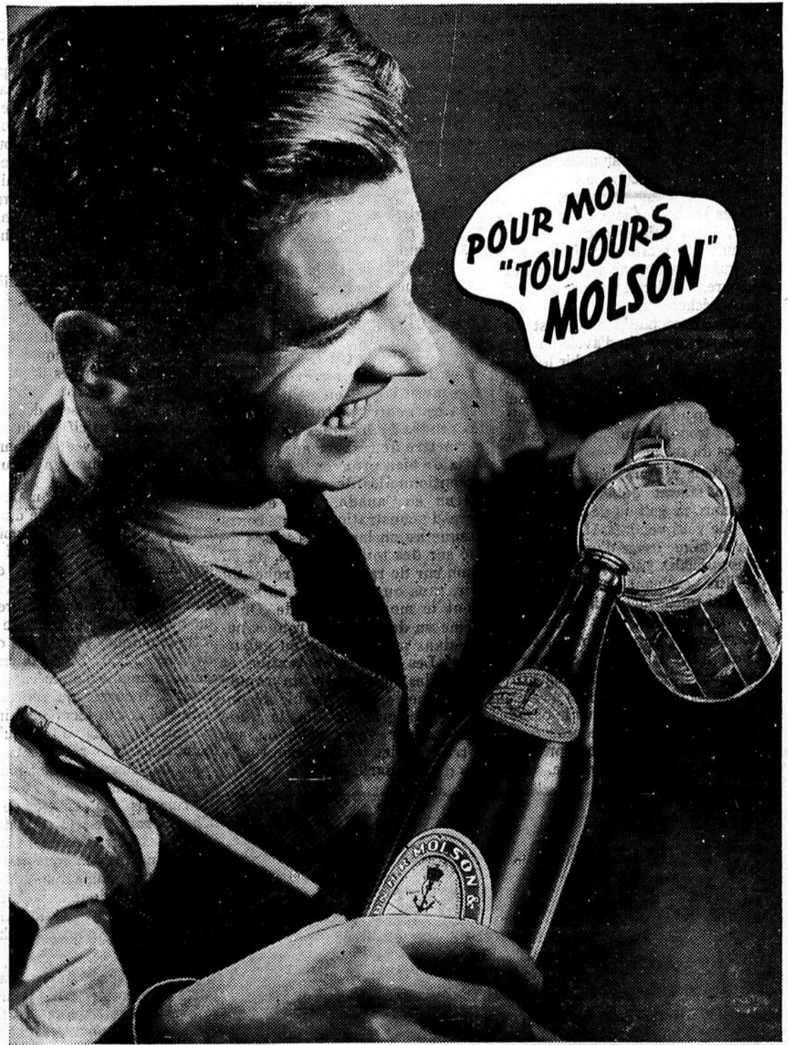
LA BIÈRE QUE VOTRE ARRIÈRE GRAND-PÈRE BUVAIT

si rappelé au comité qu'il y a quelques années, dans l'Ontario, les compagnies d'assurance avaient d'elles-mêmes réduit de 15 p.c. leurs taux d'assurance, plutôt que de se soumettre à une enquête publique. La ligue a aussi offert son plein concours au nouveau comité dont le but est de faire réduire à un niveau raisonnable les taux actuels d'assurance-automobile.