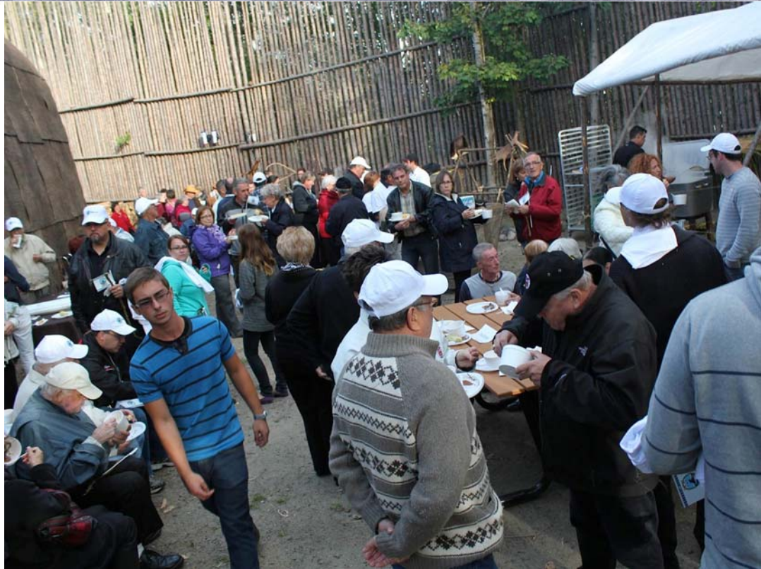
La Fête a eu lieu à l'intérieur de la palissade érigée autour de la Maison longue nationale. Un repas a été offert incluant de la sagamité avec bannique, de la viande braisée, des épis de maïs et un gâteau à l'érable et fraises

C'est sous le soleil et la bonne humeur que s'est déroulé le 253 e Anniversaire de la signature du Traité Huron-Britannique de 1760, le 5 septembre 2013. Les membres de la Nation ont été invités à prendre part à un rassemblement autour de la nouvelle Maison longue nationale dont les activités ont été officiellement lancées le même jour. Plus de 300 personnes s'étaient déplacées pour l'occasion, une foule record! Sur place, un repas traditionnel a été servi, des chandails, des casquettes et des petits drapeaux de la Nation ont été distribués et les gens ont pu visiter la nouvelle Maison longue nationale.