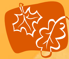
TABLE DES MATIÈRES – AUTOMNE 2013

Le Conseil de la Nation huronne-wendat souhaite de très Joyeuses Fêtes à tous les membres de la Nation, leurs familles et amis! Surveillez notre prochaine édition du Yakwennra Hiver 2014 qui paraîtra en février.