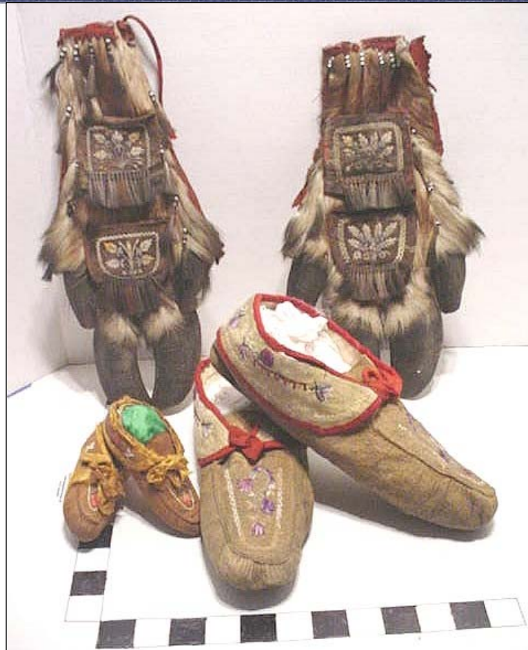
Pochettes murales fabriquées à partir de pattes de caribou, une spécialité artisanale des Hurons-Wendat, 19 ème siècle

Cette conférence est rendue possible grâce au financement accordé par Environnement Canada dans le cadre du Fonds autochtone pour les espèces en péril (FAEP) et elle aura lieu le mercredi 27 novembre 2013 à 19 heures à la salle du Conseil de la Nation huronne-wendat (255, Place Chef Michel Laveau, Wendake). Des rafraichissements seront servis sur place.