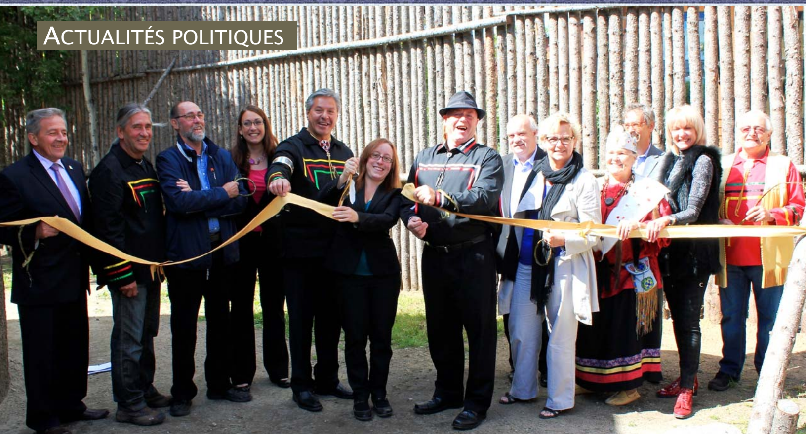
La coupure officielle du ruban de cuir par la députée fédérale de Louis-Saint-Laurent (NPD), madame Alexandrine Latendresse en présence d'élus et de partenaires