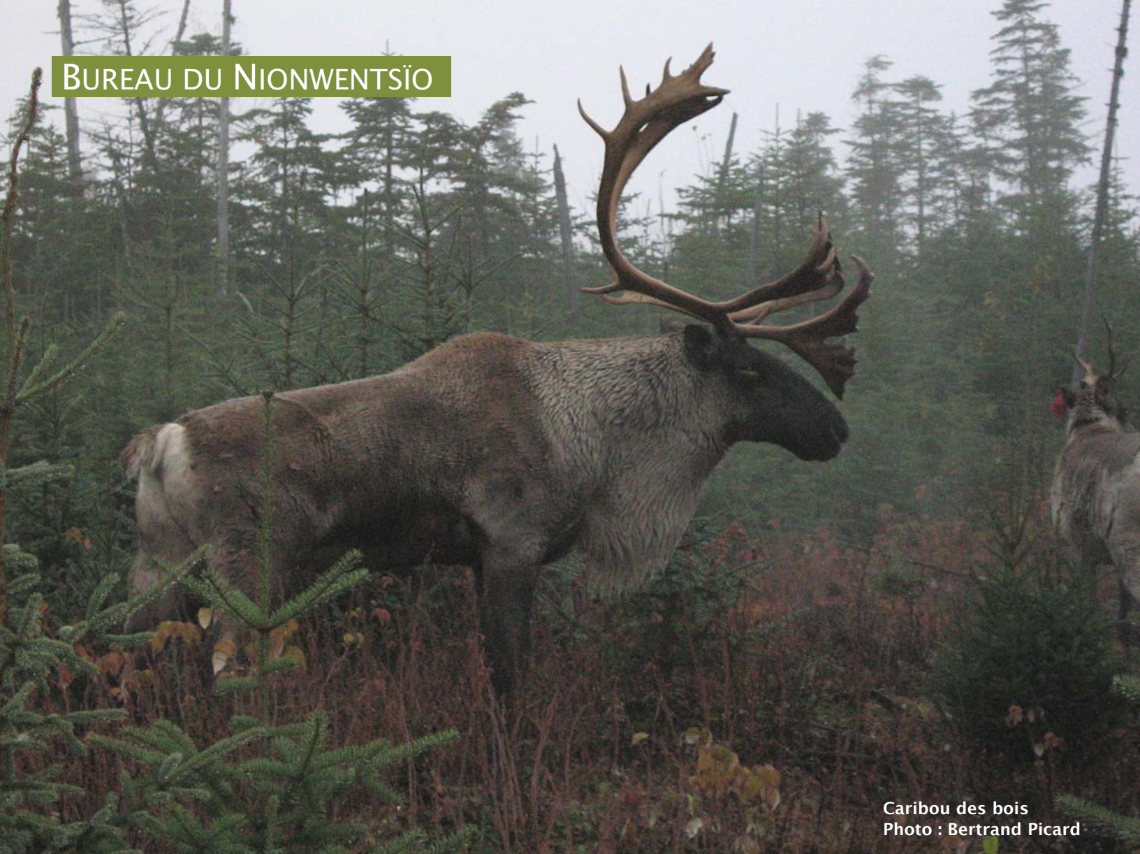
Caribou des bois