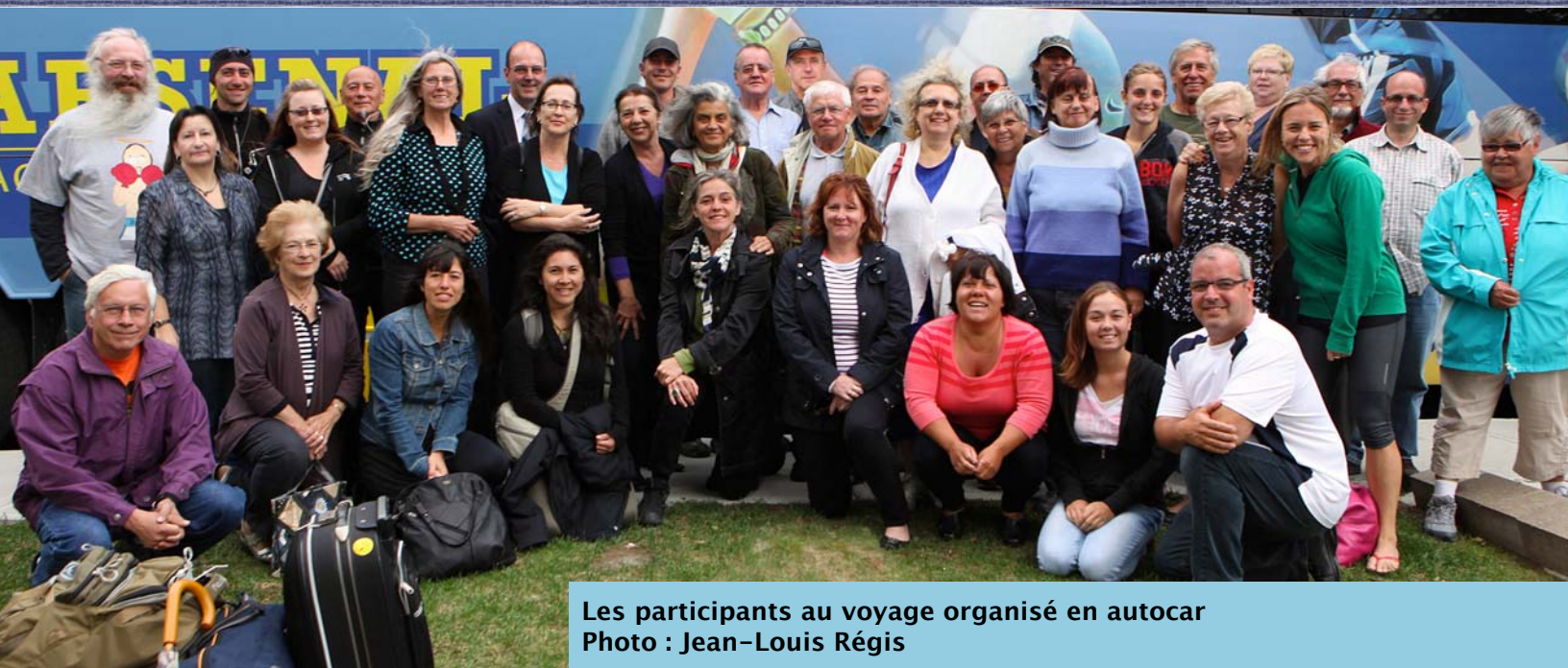
Les participants au voyage organisé en autocar