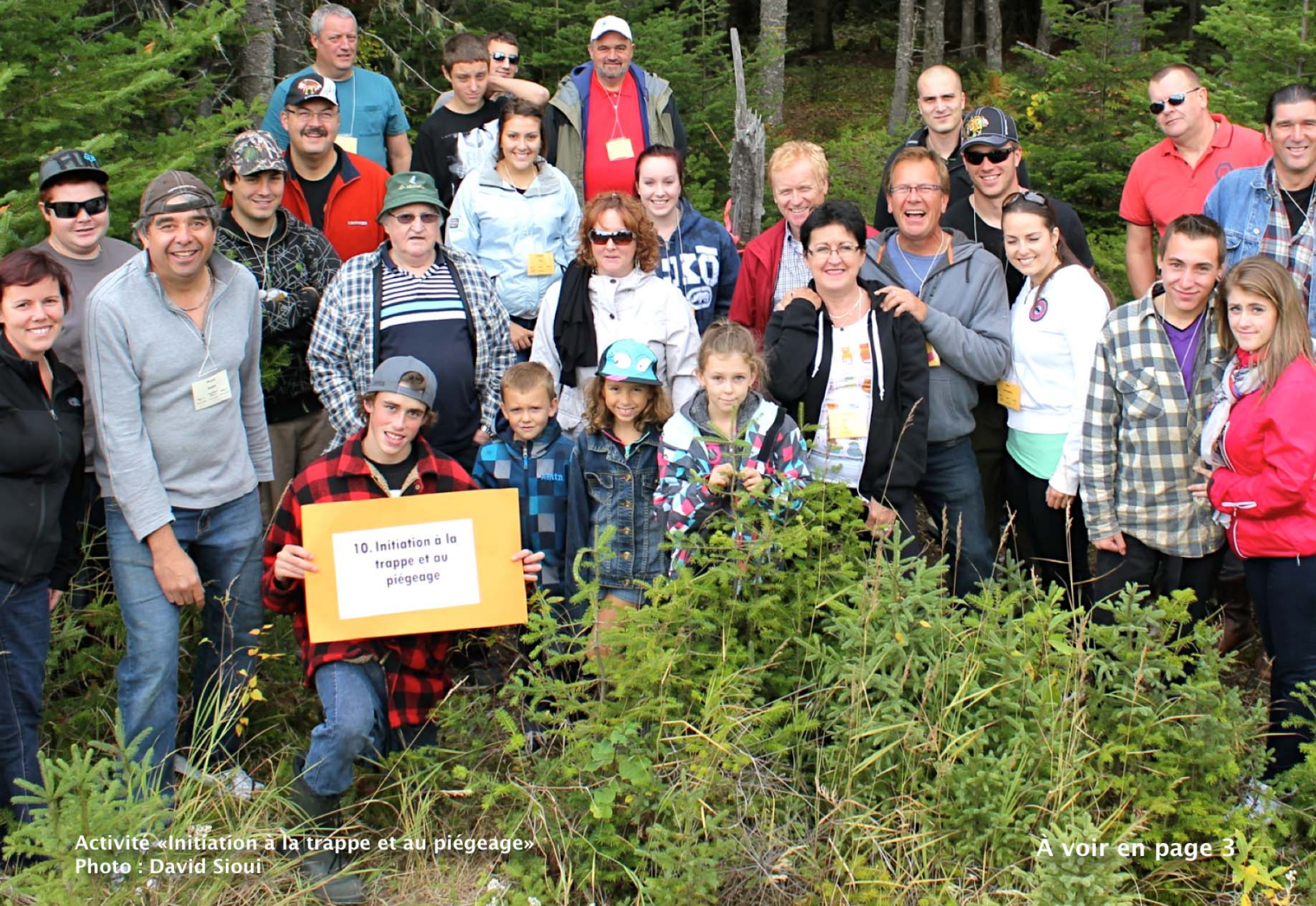
Activité «Initiation à la trappe et au piégeage»