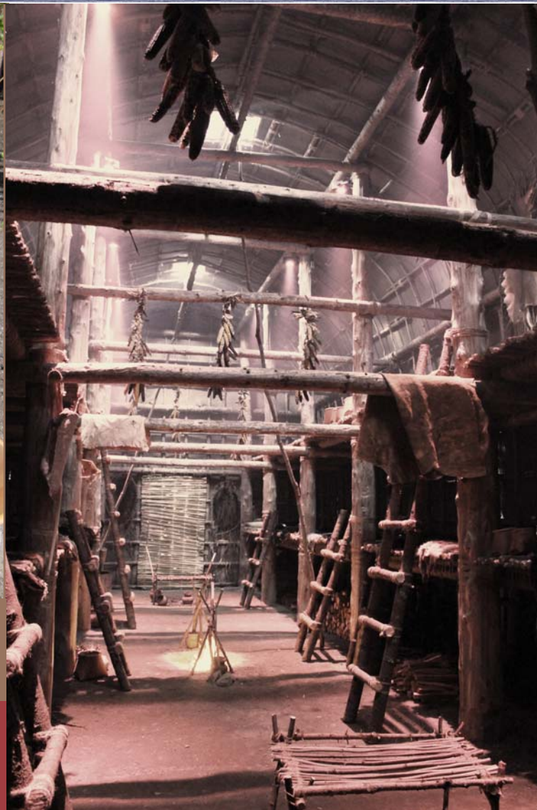
La Maison longue nationale, vue de l'intérieur