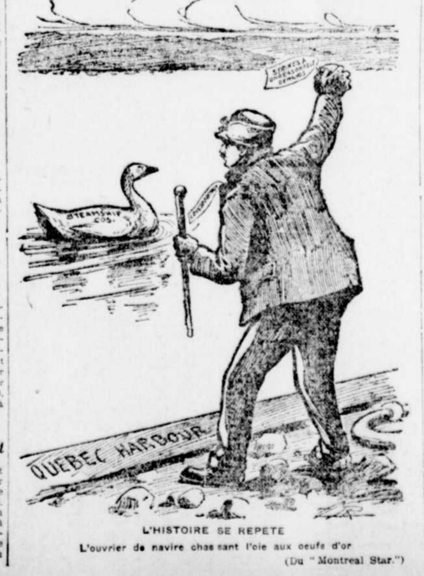
L'ouvrier de navire chassant l'oeil aux oeufs d'or (Du "Montreal Star")