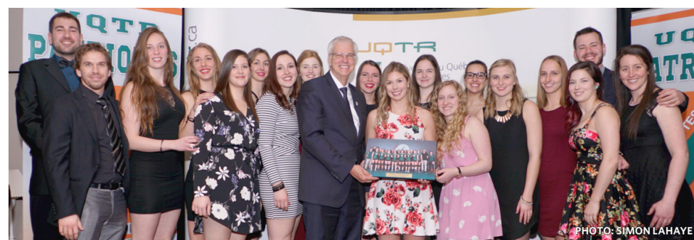
Les athlètes en volleyball féminin ont remporté le prix de l'équipe de l'année.