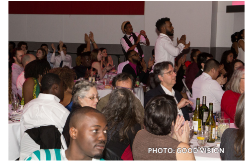
Les convives exprimaient un réel engouement envers les numéros présentés sur la scène durant toute la soirée.