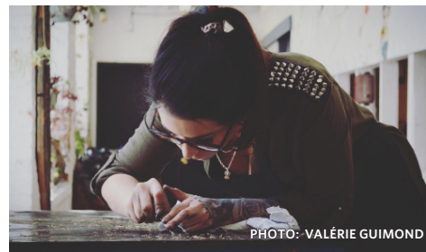
La jeune artiste travaille actuellement sur une exposition collective de gravure qui sera présentée au public à la fin avril dans le cadre d'un cours.

L'œuvre Chapitre 2.0 a malheureusement été vandalisée dans la semaine du 27 mars dernier. Comme quoi la sensibilisation à la culture et l'ouverture aux artistes restent à plaider activement, même dans un milieu novateur comme une université. (M.-C.P.)