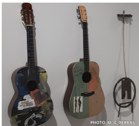
La diversité des médiums dans l'exposition rend bien hommage à l'artiste multidisciplinaire.

Cette même section de l'exposition pointe aussi du doigt les traditions familiales alors qu'est représentée une scène violente entre convives un soir de réveillon. Les deux protagonistes se chamaillent sous le regard attristé d'un autre lors du découpage de la dinde. Une image épurée d'une femme nue embrassant un homme pendu est à la fois touchante et troublante. Est-ce l'amour qui tue ou l'impossibilité d'accepter la mort de l'amour? (M.-C.P.)