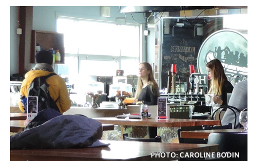
La Chasse Galerie, bistro-bar étudiant de l'UQTR.