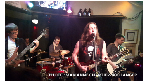
Les gagnants des quarts de finale du 4 avril, DropFate.

Le deuxième groupe, Stuck, qui rappelait le grunge de Nirvana, donne son identité à la