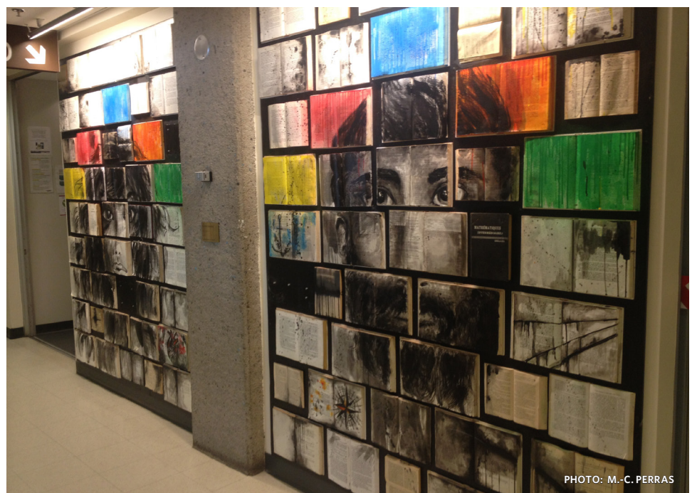
L'œuvre Chapitre 2.0 de Fannie Constant, malencontreusement abîmée par des vandales, enlumine tout de même le corridor menant à la Coopsco.