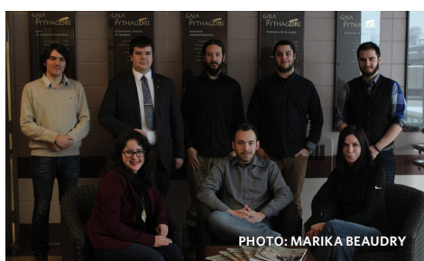
Le comité de publication de la revue Le Prométhée .

La parution du prochain numéro est prévue d'ici la mi-avril. «Le numéro suivant devrait être prêt cet été, mais on attendra l'automne pour le publier et le distribuer aux étudiants de la nouvelle cohorte. Ça permettra de toucher plus de monde!» conclut Corentin. (M.L.)