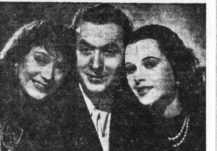
CHARLES BOYER est l'homme qui est mêlé à la vie de Sigrid Gurie et de Hedy Lamarr en même temps dans "ALGIERS", le brillant mélodrame romantique de Walter Wagner, actuellement à l'affiche du théâtre RIALTO.