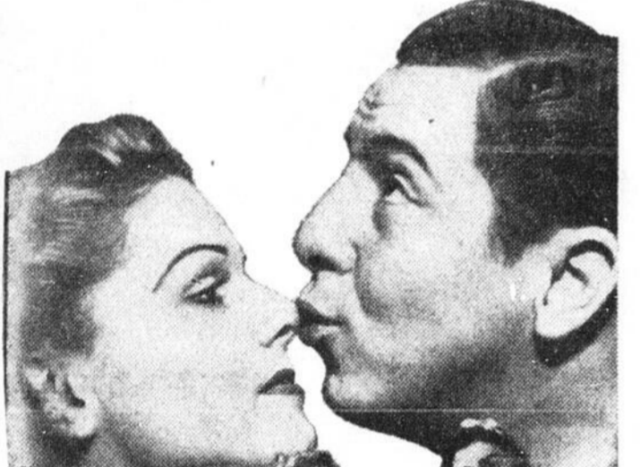
JOE PENNER et LINDA HAYES dans "Woo-Woo-Women"