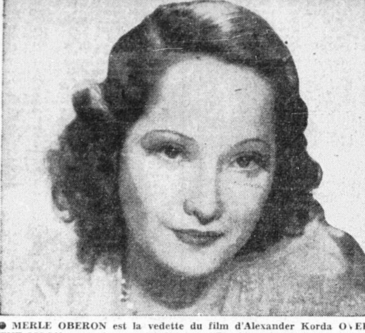
MERLE OBERON est la vedette du film d'Alexander Korda OVER THE MOON en couleurs naturelles; l'Empire présente pour une semaine commençant aujourd'hui avec un autre grand film et les sujets courts.