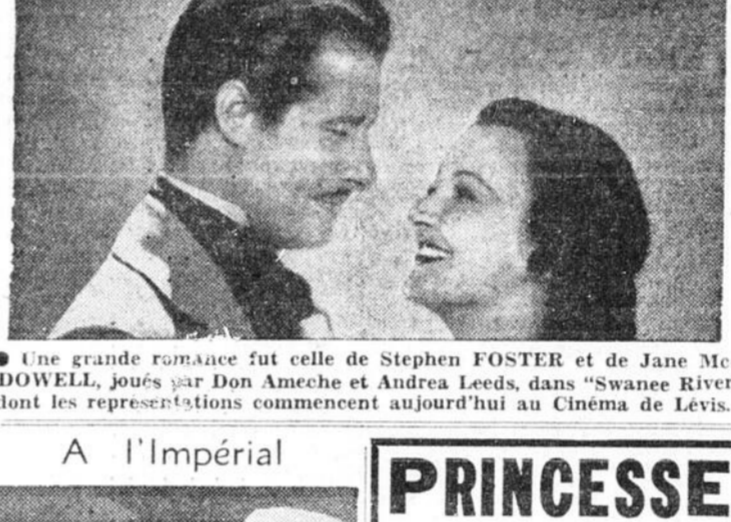
Une grande romance fut celle de Stephen FOSTER et de Jane McDowell, joués par Don Ameche et Andrea Leeds, dans "Swanee River" dont les représentations commencent aujourd'hui au Cinéma de Lévis.