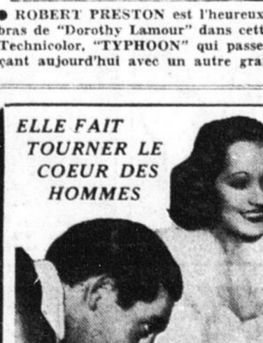
ALEXANDRE KORDA présente MERLE OBERON dans "THE DAY THE BOOKIES WEP" avec JOE PENNER