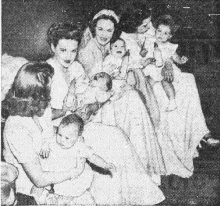
Voici une photo qui parle par elle-même. Ce sont les sœurs Lane et Gale Page que vous savez connues dans "Four Daughters" et que vous retrouverez dans FOUR WIVES au Cartier en programme double aujourd'hui.