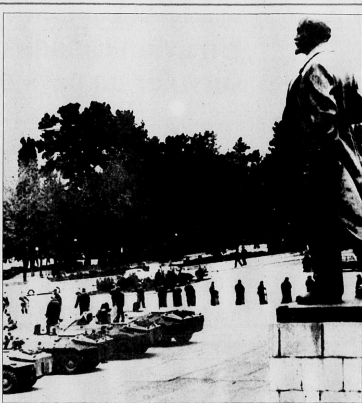
À Stepanakert, capitale de l'enclave arménienne du Nagorno-Karabakh, en Azerbaïdjan, des blindés supplémentaires ont été envoyés par Moscou pour faire face aux tensions croissantes dans la région.