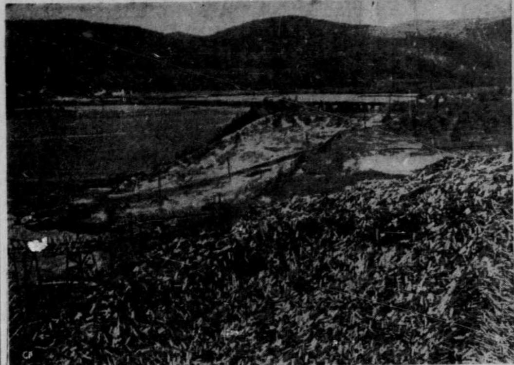
LA MATIÈRE DU PAPIER — Cet immense tas de billets, qu'on voit ici, deviendra du papier. Il s'agit, en l'occurrence, des provisions de la Brown Corporation, à La Tuque. Le tas comprend environ 75,000 à 100,000 cordes de bois.