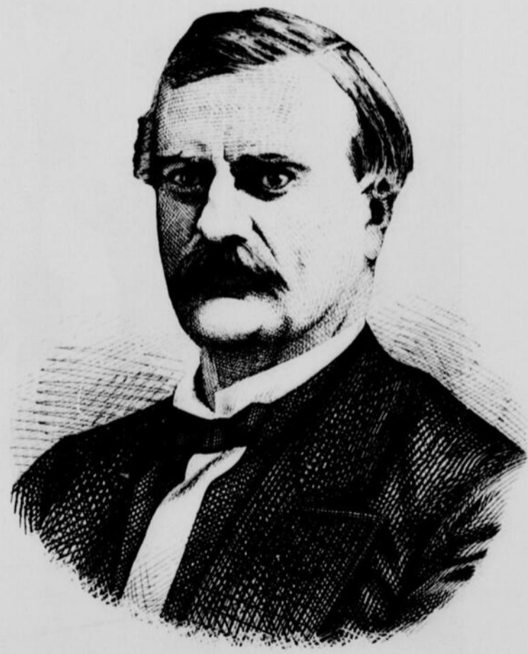
L'HON. LUC LETELLIER DE ST. JUST, MINISTRE DE L'AGRICULTURE