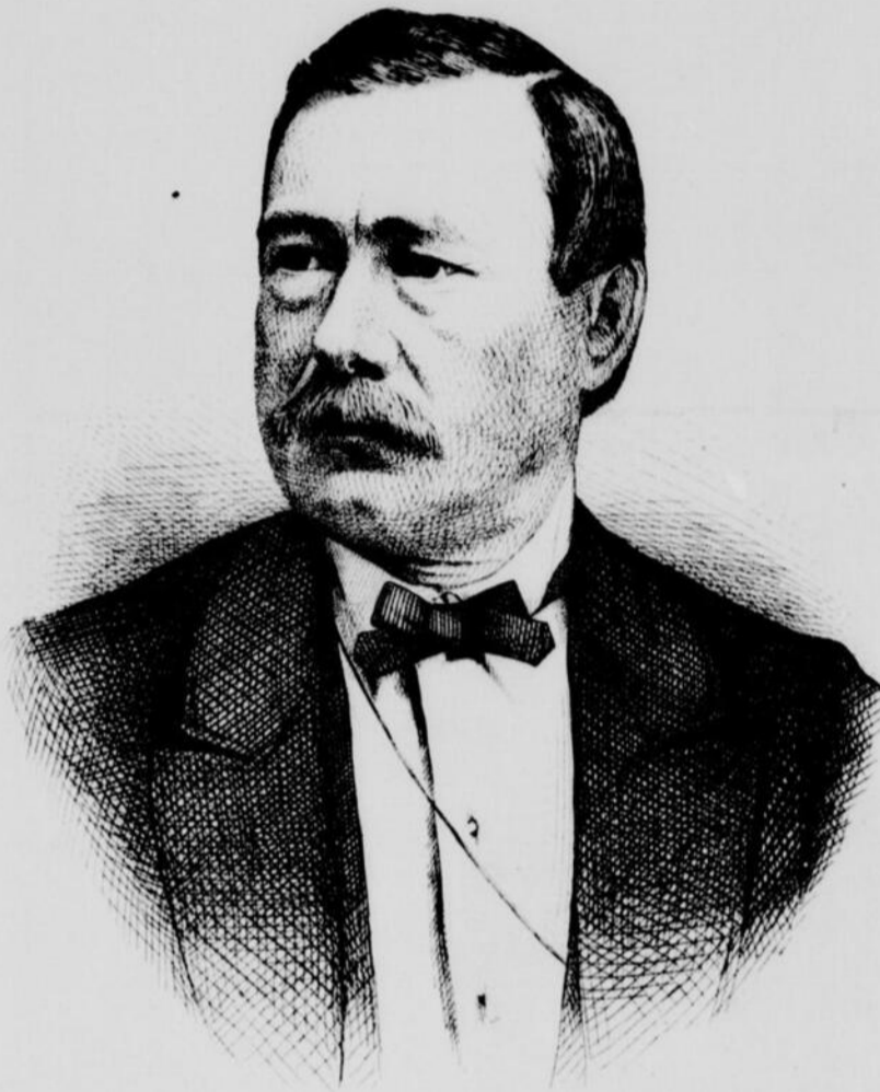
L'HON. TÉLESPHORE FOURNIER, MINISTRE DE LA JUSTICE