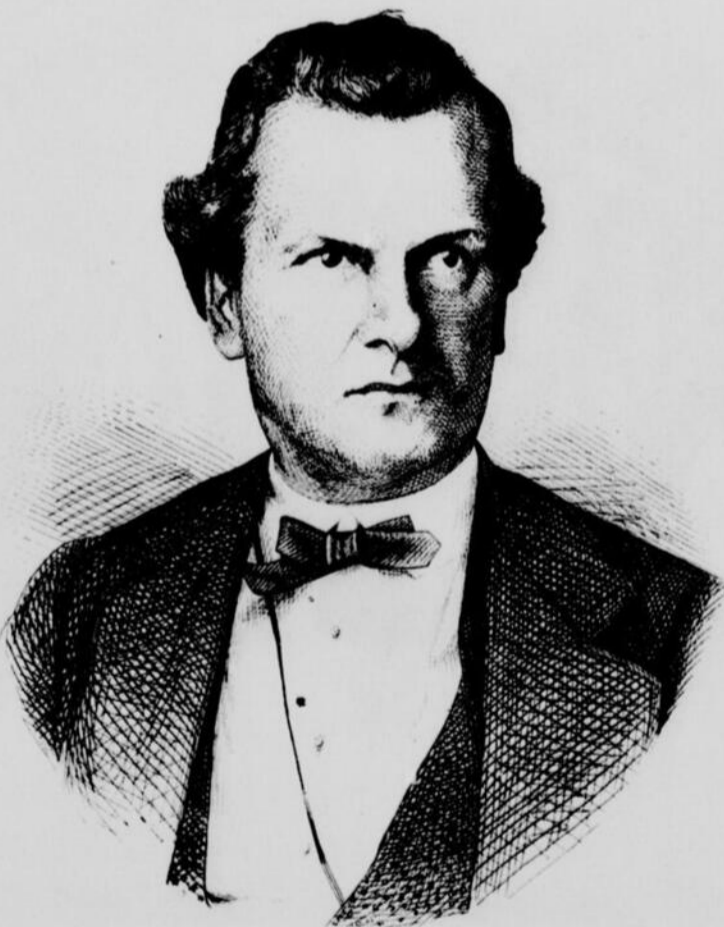
L'HON. FÉLIX GEOFFRION, MINISTRE DU REVENU DE L'INTÉRIEUR