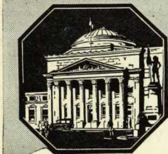
Siège social: Montréal

De l'étude légale: Rés. 70, St-Germain Bienvenue, Lacroix & Label Tél. 9953