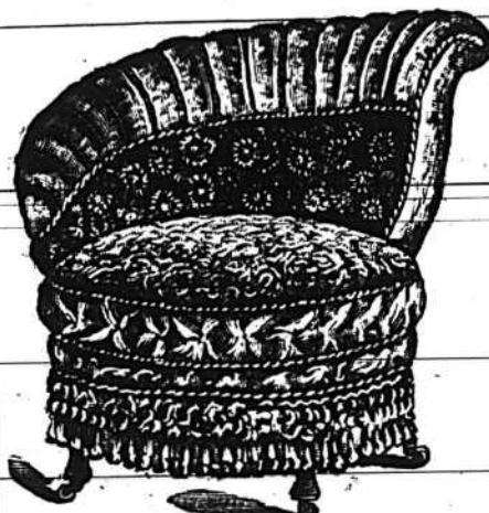
18 mai 1888.