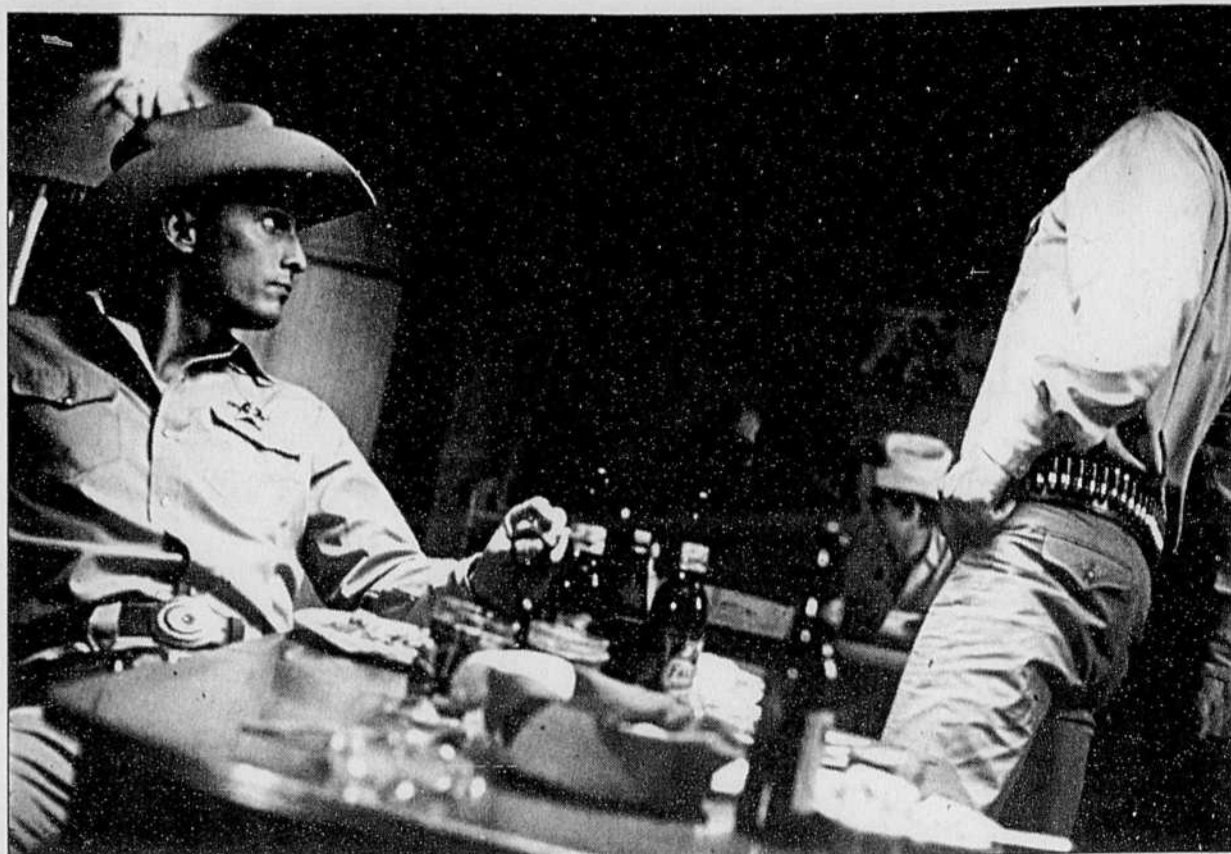
Une scène de Lone Star

Mais d'une façon ou d'une autre, à l'aveugle ou à la carte, L'Océan des origines est une expérience fascinante qui, autant par la profusion d'informations qu'on y trouve que par la brillante façon dont elles sont présentées, réussira à remonter le moral des plus endurcis. Ça s'adresse aux 7 à 77 ans. Et malheureusement, ça ne roule que sur PC.