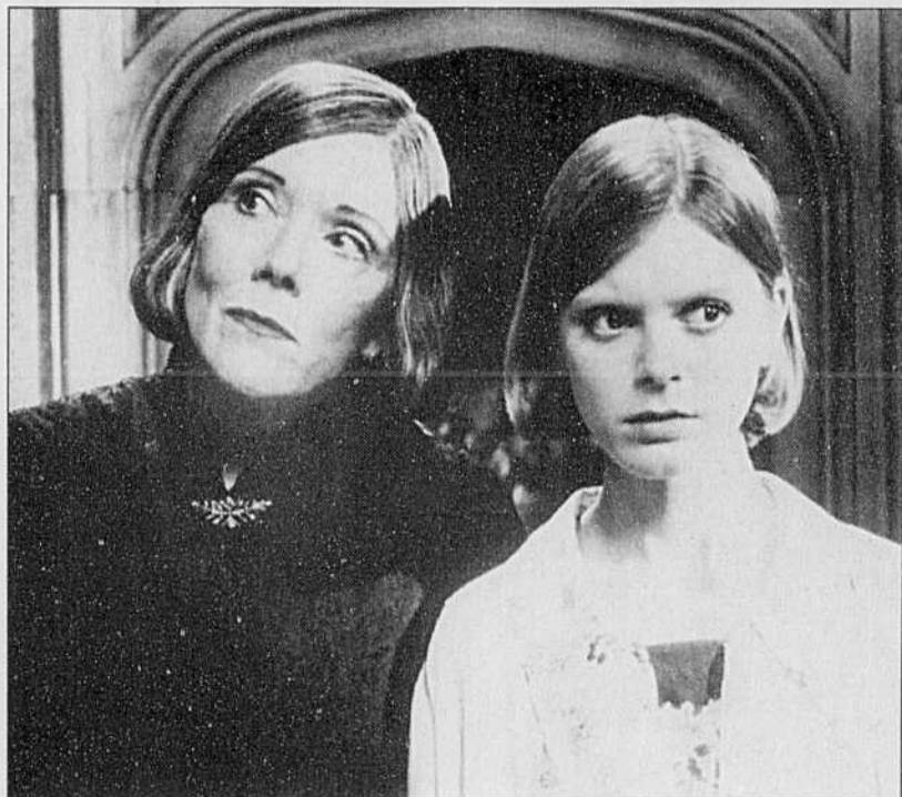
Diana Rigg et Emilia Fox, dans la nouvelle production télévisuelle de Rebecca.

Le téléfilm britannique rétablit la version de Daphné du Maurier dans laquelle Max de Winter a bel et bien étranglé son épouse