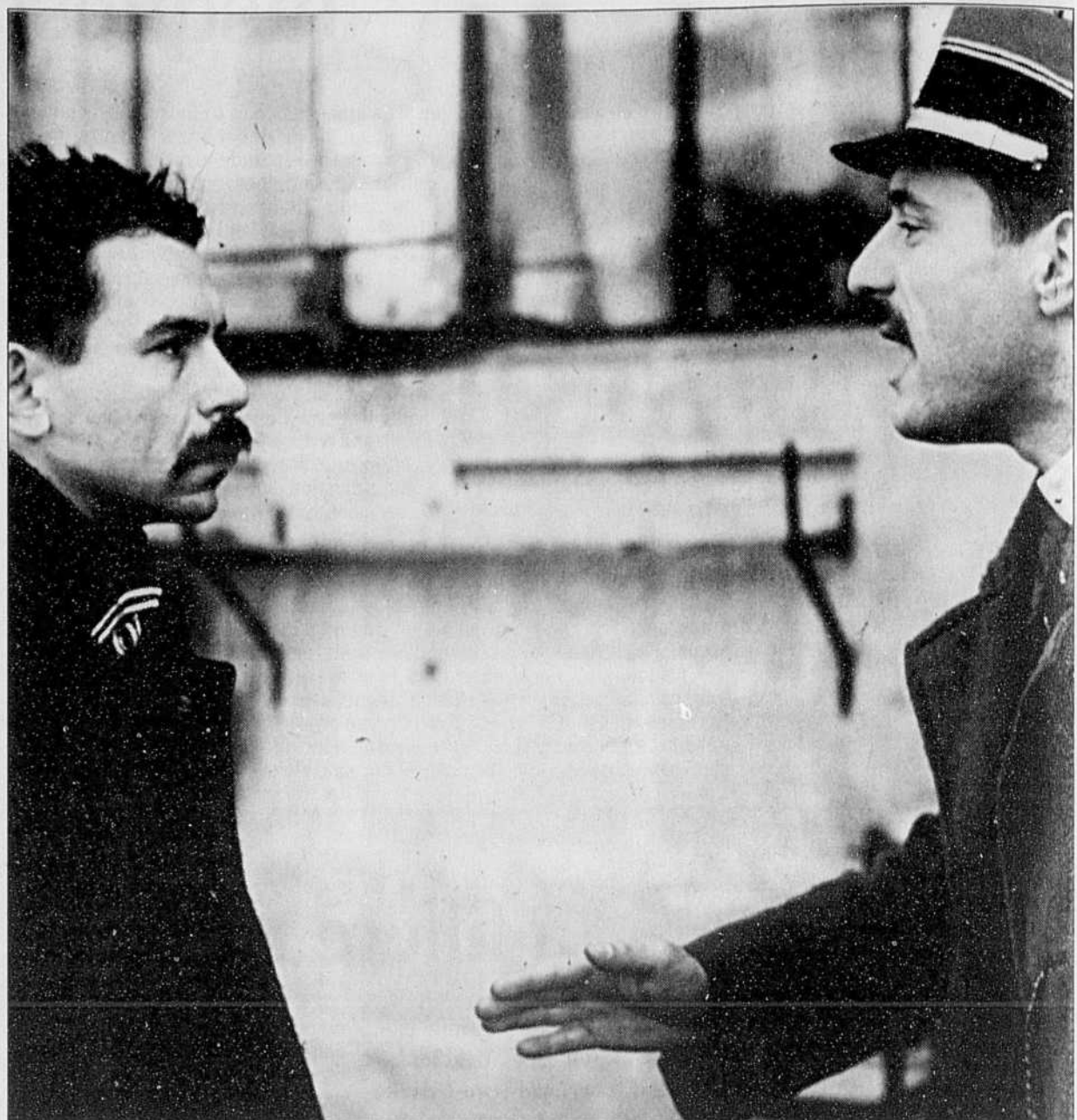
Philippe Torreton (à gauche) dans Capitaine Conan

Von Trier a privilégié le plaisir du spectacle au décodage et à l'analyse. C'est pourquoi The Kingdom ne s'encombre ni de psychologie raffinée ni de personnages aux reliefs multiples. C'est dans la quantité que le relief se dessine, et c'est dans l'unité de ton que l'action trace son chemin. L'ascension dramatique est assez lente dans la première heure, mais le parcours de ce labyrinthe obsédant atteint ensuite son plateau hypnotisant, qui nous fera pardonner à Von Trier certaines complaisances (dans la représentation sans fard d'opérations chirurgicales, notamment) et la finale grand-guignolesque un peu facile qui précipite la chute à un rythme d'enfer.