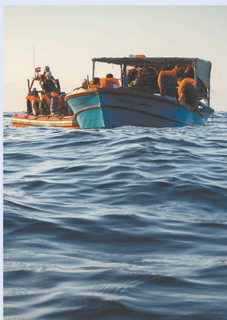
Le bateau de sauvetage de l'Aquarius portant secours à des migrants

L'Aquarius demande à la France un feu vert « humanitaire »