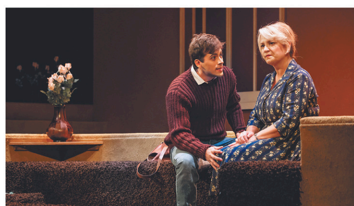
Les comédiens ne sont pas forcés au mouvement ; leurs corps laissent toute la place à leur parole entravée.

Avec Le vrai monde ? , le Trident met en valeur la générosité de Tremblay