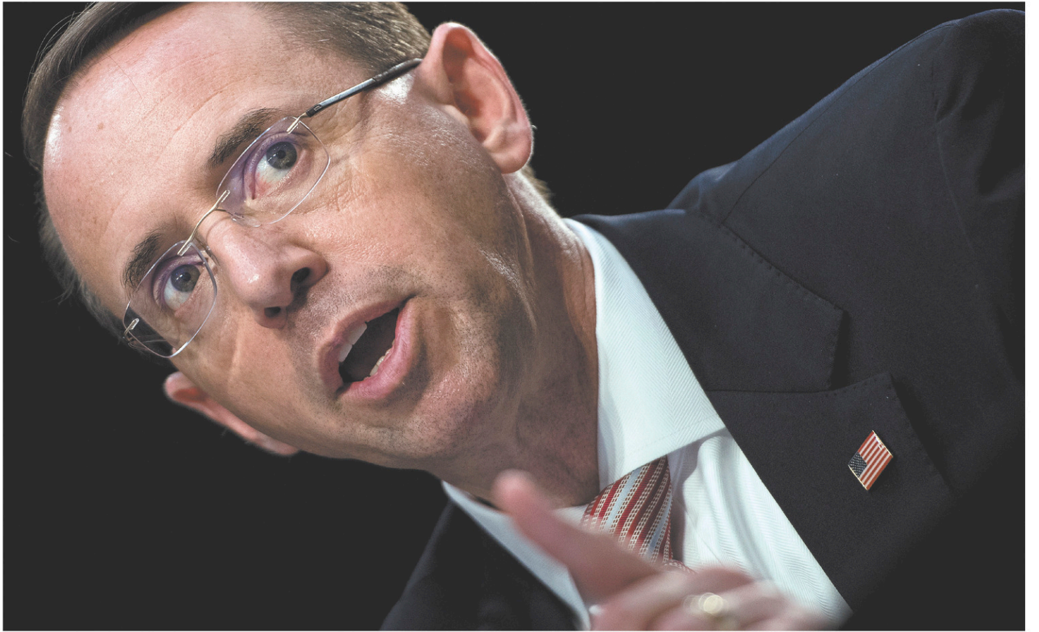
Donald Trump et Rod Rosenstein ont eu, à la demande de ce dernier, « une longue conversation pour évoquer les récents articles de presse », a indiqué la porte-parole de la Maison-Blanche, Sarah Sanders.