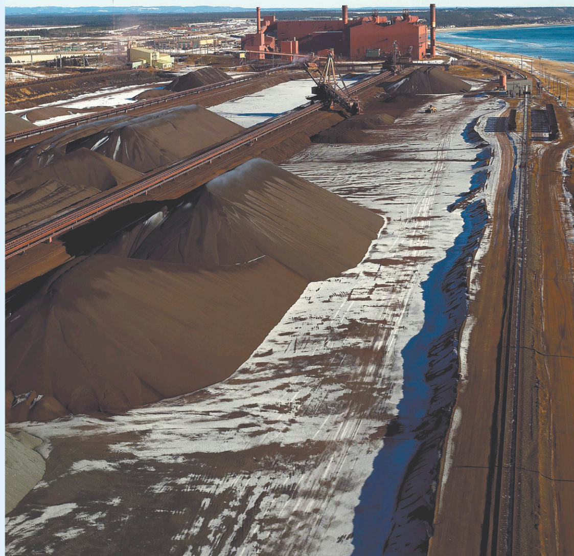
L'aire de stockage sur le site des installations portuaires de la compagnie minière IOC à Sept-Îles