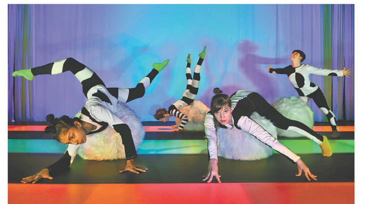
La pièce À travers mes yeux est une véritable ode à la beauté.

En réelle symbiose avec la musique, ces dernières bougent au rythme des sons, font corps avec elle. Un des moments forts de la prestation reste sans doute ce tableau dans lequel le plan-