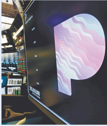
Pandora est l'un des premiers services de streaming musical aux États-Unis.