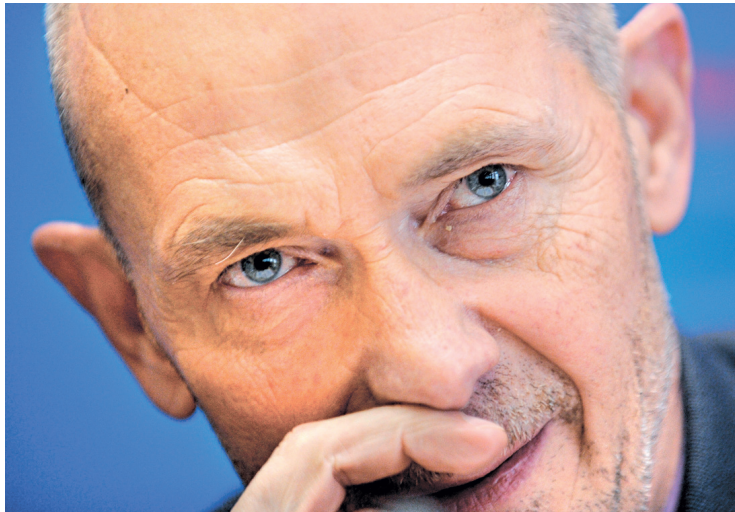
Pascal Lamy: «L'ampleur des écarts entre les principaux acteurs bloque les progrès dans d'autres domaines [...]»

«Mon évaluation franche est que dans de bonnes conditions [...], un accord serait faisable, en gardant à l'esprit que "rien n'est convenu tant que tout n'a pas été accordé"», a jugé M. Lamy. Toutefois, il a précisé que son jugement ne vaut que si les pays parviennent à trouver un accord sur les produits industriels «où l'ampleur des écarts entre les principaux acteurs bloque les