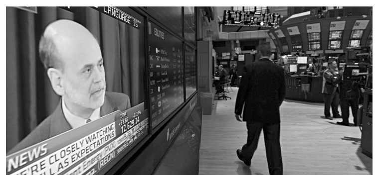
Première conférence de presse de Ben Bernanke immédiatement après une réunion de la Fed sur les taux d'intérêt.

HIER À LA BOURSE: Le vent a tourné en fin de séance à Toronto, son indice de référence progressant après avoir passé la plus grande partie de la journée dans le rouge. La performance des actions liées aux matières premières a permis de compenser la chute d'un poids lourd du marché, Research in Motion.