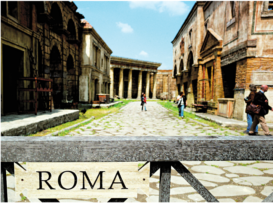
Le décor de quatre hectares de la série télévisée internationale Rome : temples du Forum en carton-pâte plus vrais que nature, via sacra pavées de «vraies fausses pierres»... c'est sans doute le clou de la visite!

Ces trésors ont pu être réunis grâce à la collaboration, entre autres, du musée du cinéma de Turin, de la Cinémathèque française de Paris et du Centro sperimentale di cinema, unique