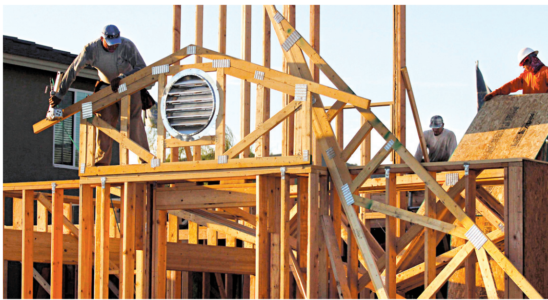
Y aura-t-il oui ou non une commission? Et si oui, à huis clos ou non?

Dans une commission d'enquête, les frais d'avocats sont pris en charge par l'État. Le compteur peut tourner longtemps. Dans le cadre de la Commission Poitras, portant sur la Sûreté du Québec (SQ), il s'est arrêté 20 millions de dollars... Et il y a enfin cette question émbêtante, toute