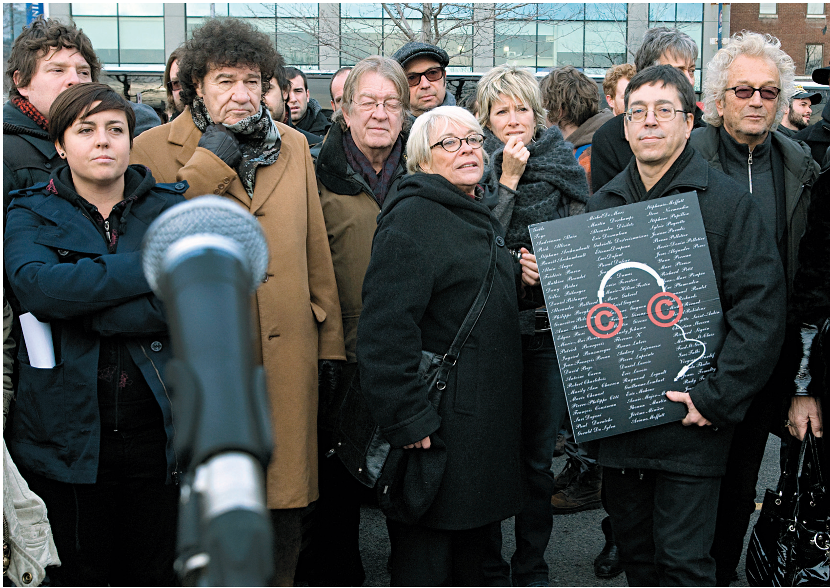
En décembre 2010, nombre d'artistes québécois touchés par le projet Loi sur le droit d'auteur se sont rendus à Ottawa manifester leur désaccord.