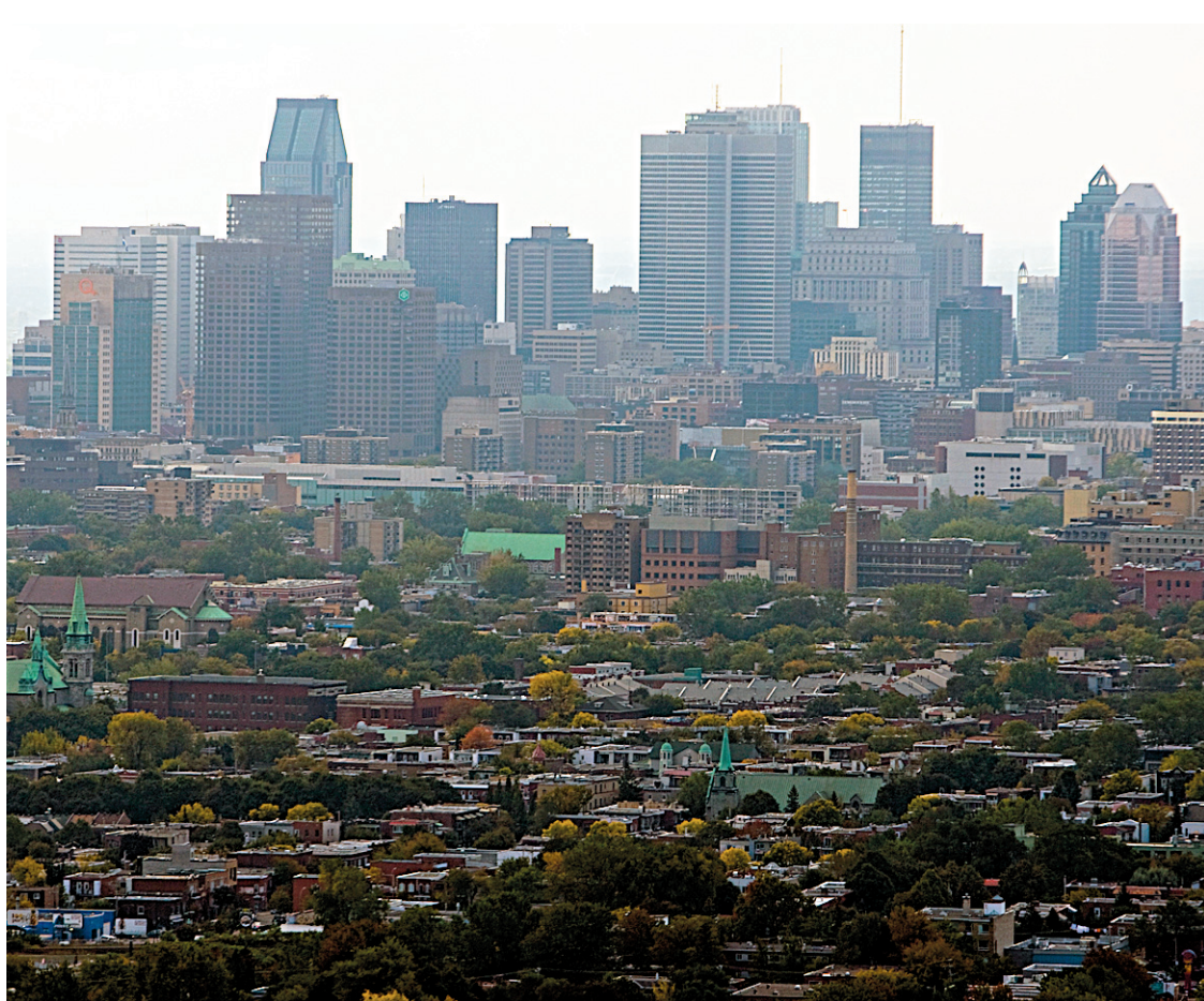
Les points de vue sur le plan d'aménagement sont forts diversifiés.