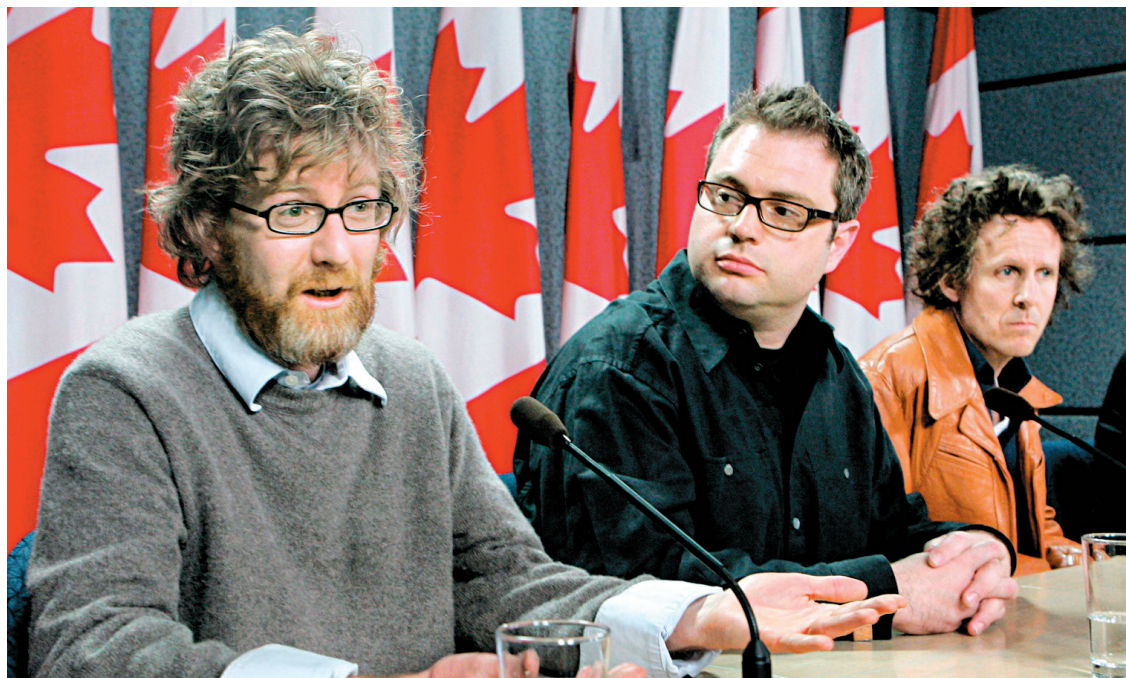
Déjà en 2006, des musiciens du Canada anglais rencontraient les politiciens pour discuter des changements nécessaires aux droits d'auteur.