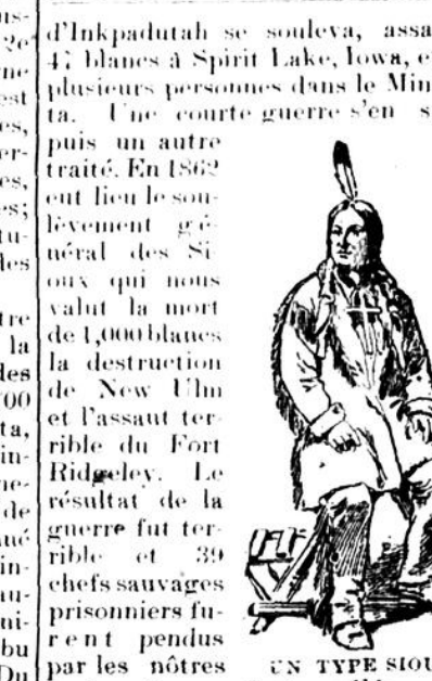
LE CHIEF GALL.

On peut aujourd'hui reconnaître l'étendue de leur domination par la mélodie des noms des lacs et des rivières qui se trouvent dans les 700 milles de l'est à l'ouest; Minnesota, Minnesota, Minnetonka, Minnetonka, Minnetonka, Minnetonka.