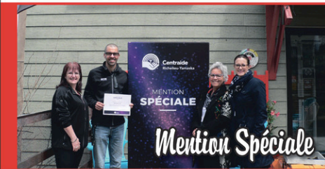
Ski Sutton inc