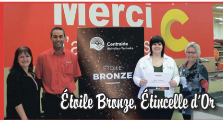
Super C - Cowansville