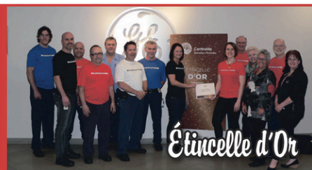
GE Aviation Bromont