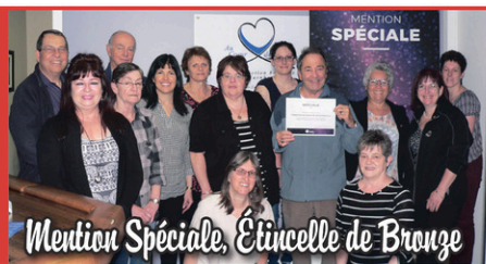
Centre d'action bénévole de Farnham inc.