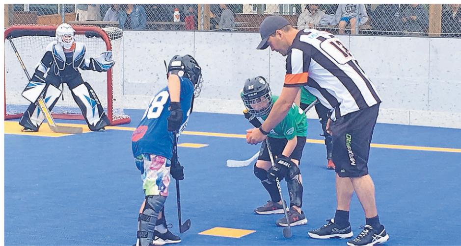
Les équipes adultes évoluent à quatre joueurs contre cinq, gardien en sus, alors que les équipes de niveau junior empruntent plutôt la formule du hockey sur glace (cinq contre cinq, gardien en sus).

Des séances de perfectionnement pour les jeunes (enseignement sur surface et mise en