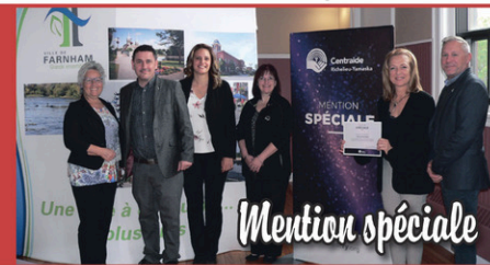
Ville de Farnham

Félicitations également à ces récipiendaires de la région qui ne figurent pas sur les photos