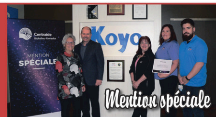
Roulements Koyo Canada inc.