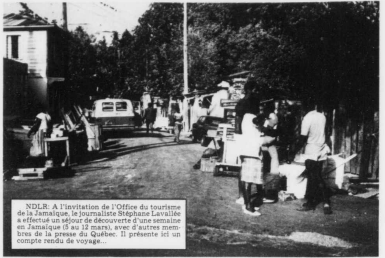
NDLR: A l'invitation de l'Office du tourisme de la Jamaïque, le journaliste Stéphane Lavallée a effectué un séjour de découverte d'une semaine en Jamaïque (5 au 12 mars), avec d'autres membres de la presse du Québec. Il présente ici un compte rendu de voyage...

À l'ouest de MoBay, Ocho Rios (6,100 habitants), un des six centres touristiques de Jamaïque, présente le même charme que les autres rendez-vous de la côte