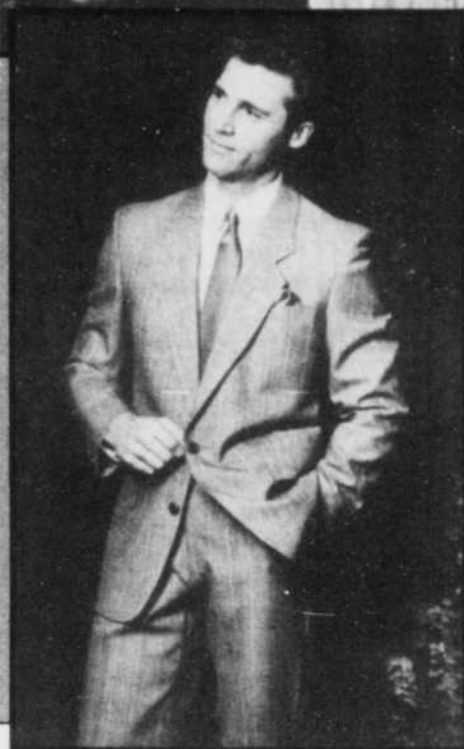
Un complet à devant droit avec rayure en relief de ton melon, ce qui ajoute une touche discrète à ce tissu 100 p.c. laine à carreaux poivre et sel. C'est complété d'une chemise habillée à rayures multiples et d'une cravate en soie.