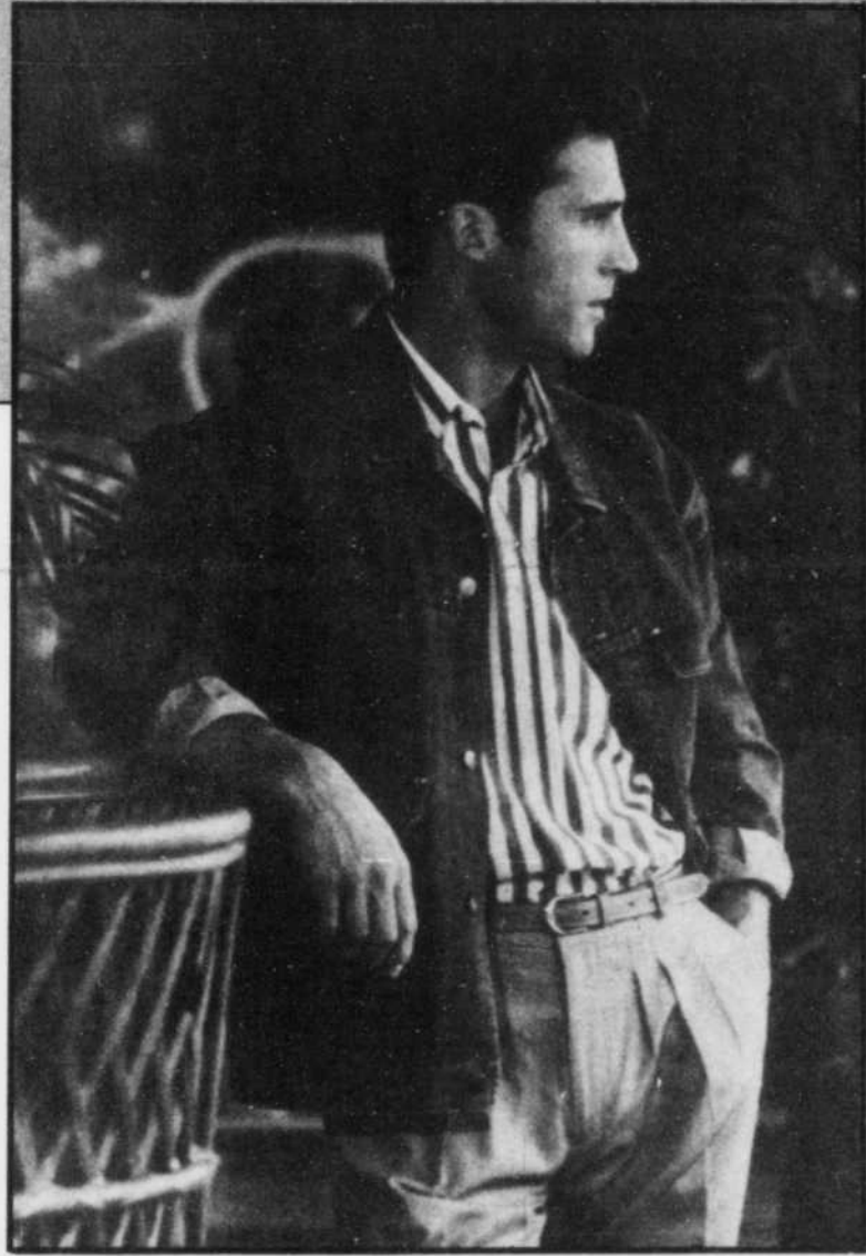
Le mariage du denim et du sergé... Les rayures de la chemise sont bleues voyantes. Le pantalon en sergé à plis multiples est de couleur tan.