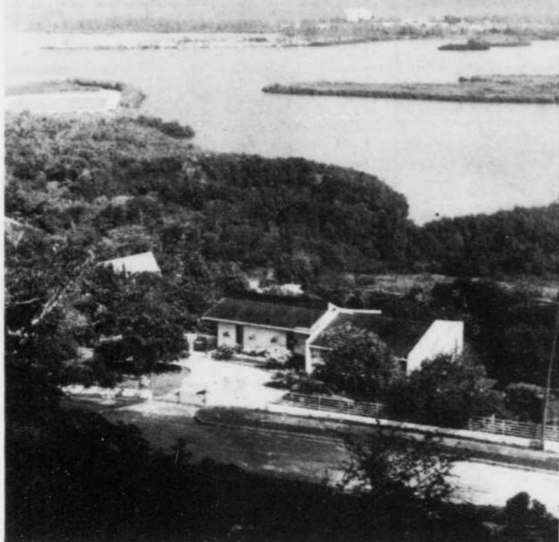
A bord du train, une vue imprenable sur la mer et les environs de Montego Bay.

Fondation Jules et Paul-Emile Léger 130, avenue de l'Épée Outremont, Québec H2V 3T2 (514) 495-2409