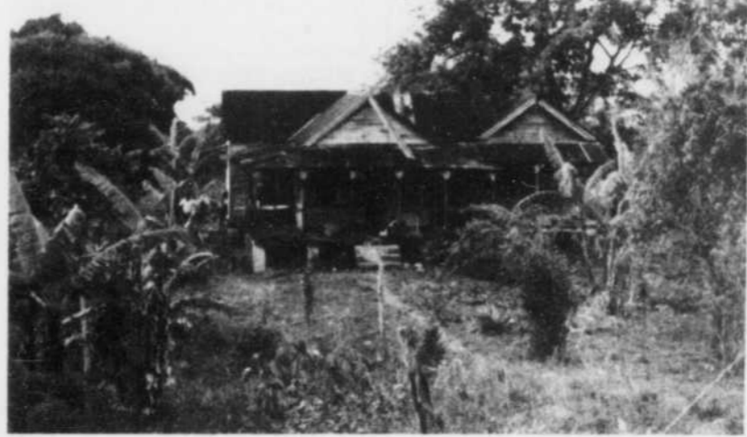
Modeste demeure dans les bois, prise à partir du train, dans la campagne jamaïcaine.