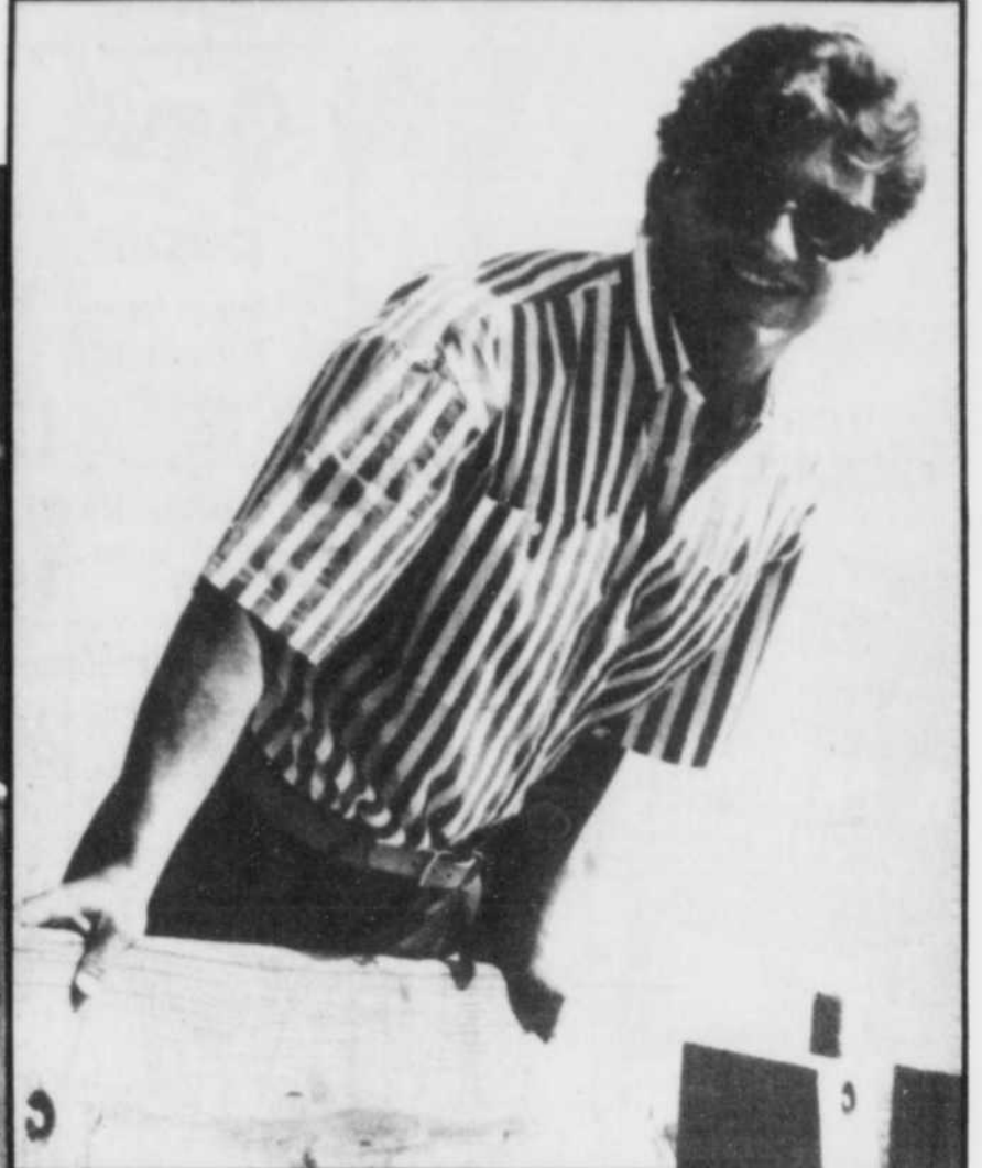
Chemise très ample aux rayures très larges, avec un pantalon en denim 100 pour cent.