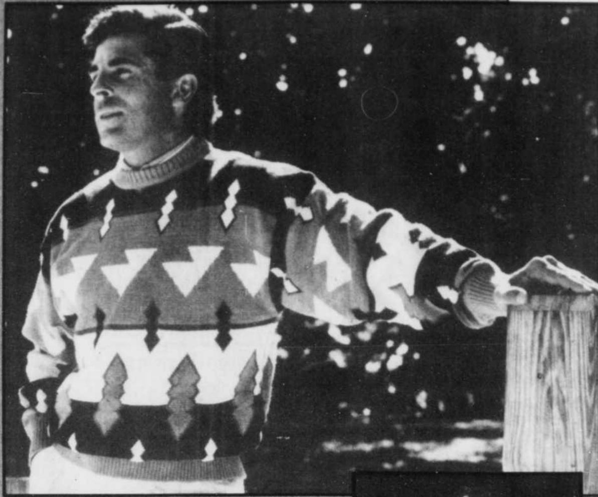
Style du sud-ouest dans ce cardigan à motif d'inspiration Indien Pueblo, dans les tons de terra cotta, marin et écreu. Dessous, une chemise rayée et un pantalon en sergé de ton écreu.

Les cinéphiles qui ont vu "Wall Street", la plus récente production d'Oliver Stone, reconnaîtront le style de Robert Stock. Ce film marque l'entrée du designer dans le monde cinématographique.