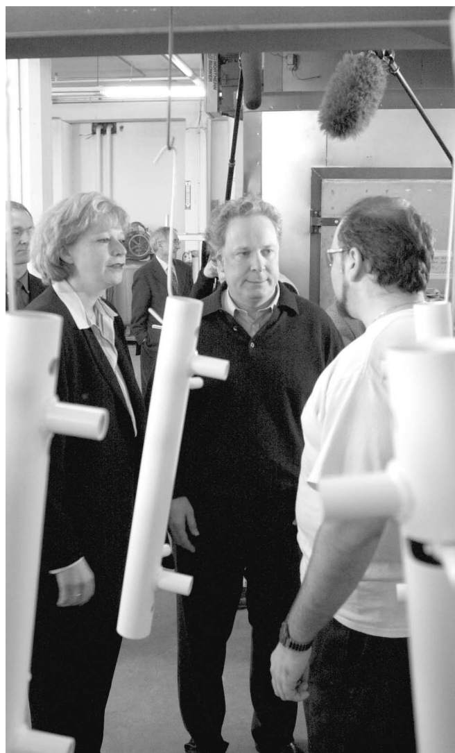
Jean Charest et la candidate Monique Jérôme-Forget ont fait un tour à l'entreprise Formetal, lundi.

Le PQ fait bien, malgré tout, de sillonner les routes de la province à la reconquête des circonscriptions égarées, le taux de participation des autochtones aux élections étant très bas.