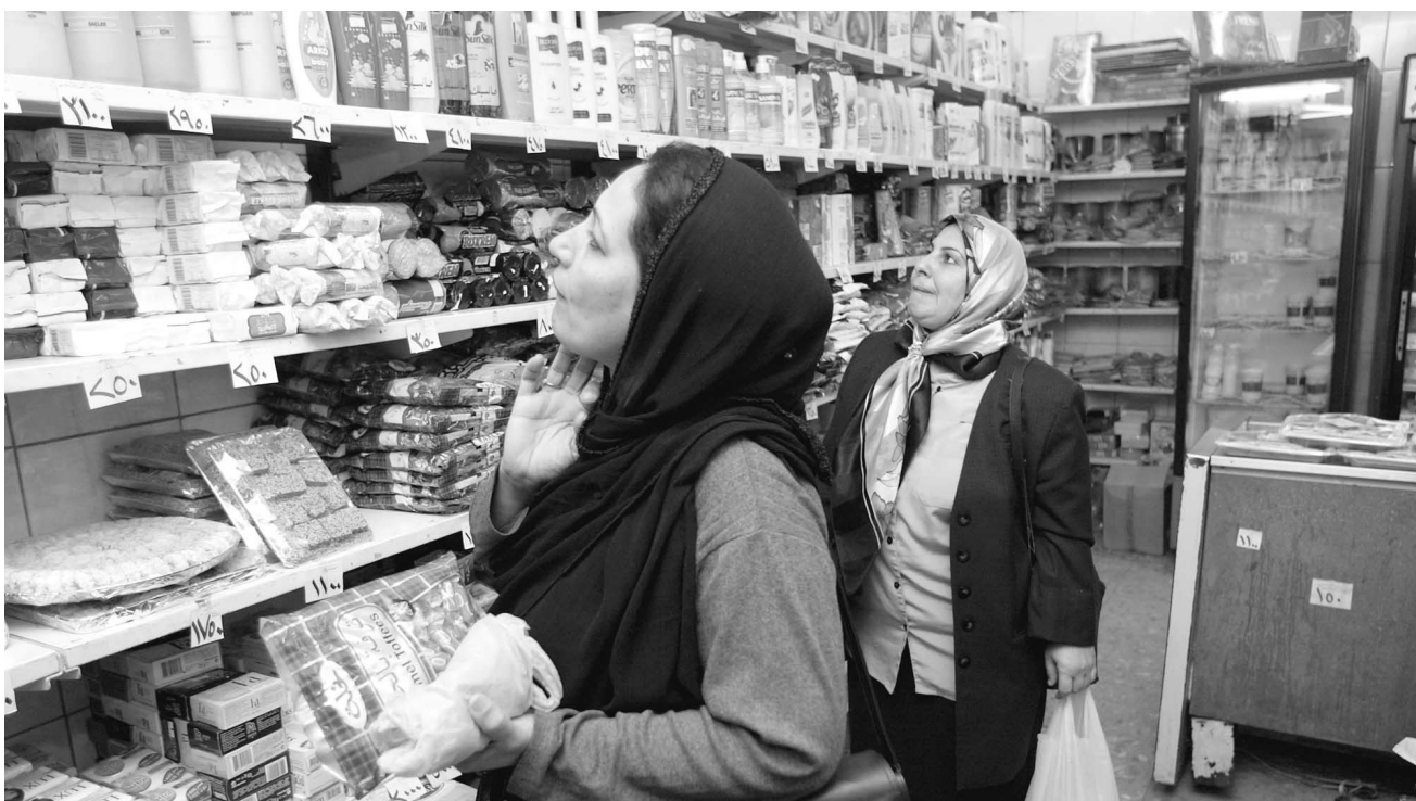
Deux Bagdadaises faisant leur épicerie le 10 février dernier.

Mais les ambitions de l'administration Bush en matière de reconstruction vont bien au-delà de l'aide humanitaire, note le correspondant du Monde à New York. L'objectif du président est de ramener en 12 mois l'économie irakienne à son niveau d'il y a deux décennies, avant la guerre contre l'Iran. Il s'agit non seulement de rebâtir et de réparer les infrastruc-