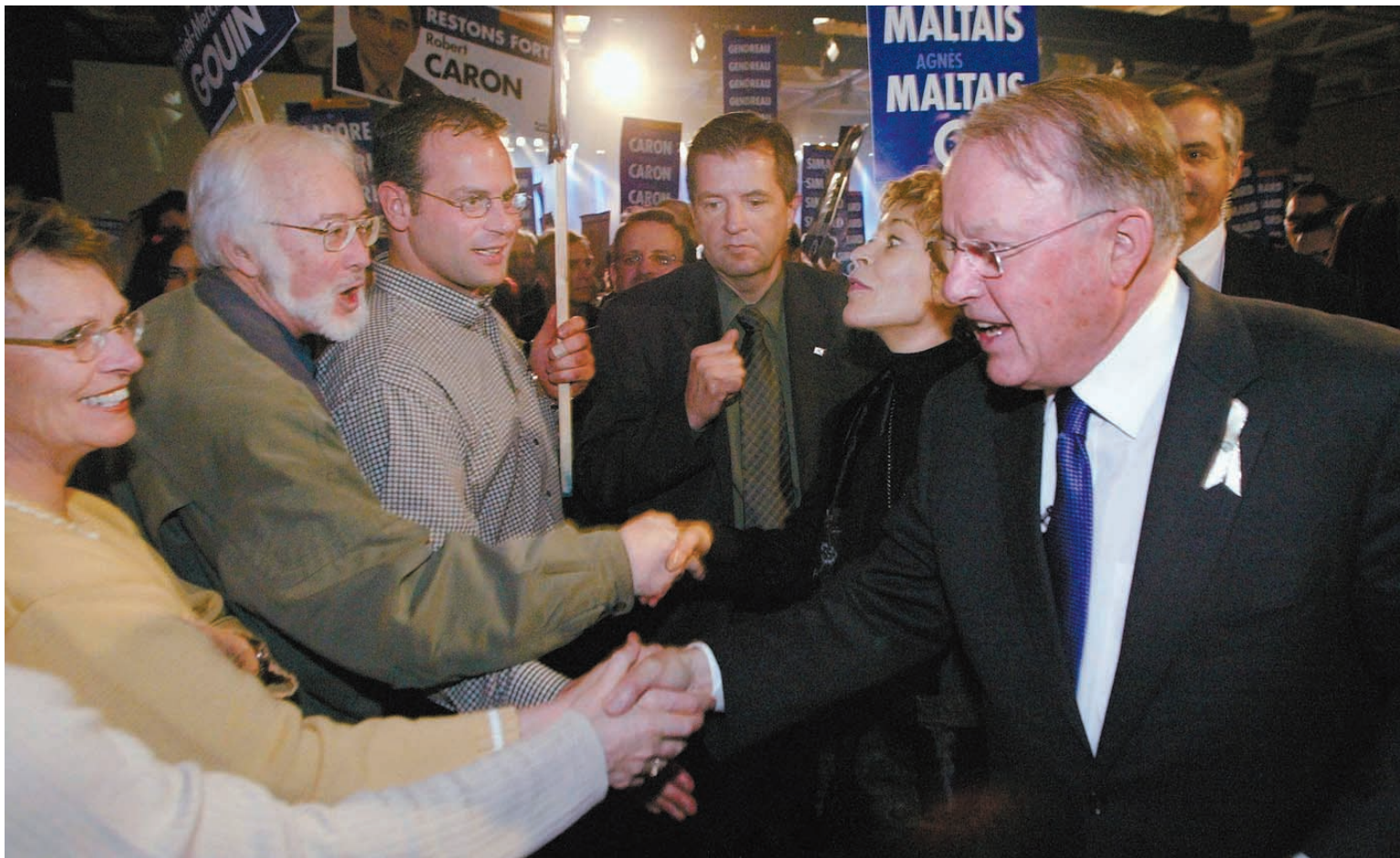
Le PQ a réuni ses troupes en assemblée, hier, au Centre des congrès de Québec, avec tous les candidats de la région de la Capitale nationale. Devant plus de 800 militants, Bernard Landry a réitéré qu'ils devaient continuer le travail jusqu'au bout.

Prendre du recul ? À deux jours du débat ? À deux semaines du vote ? Pour un chef de parti qui joue son avenir politique dans cette campagne, pas de doute, Jean Charest a fait le plein de confiance depuis 1998.