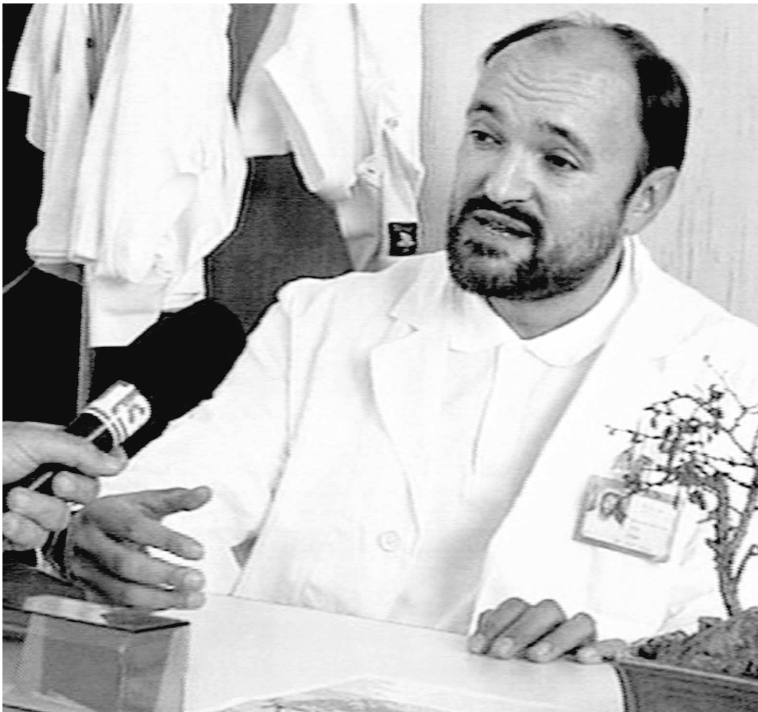
Le médecin italien Carlo Urbani avait repéré l'apparition de la pneumonie atypique à la fin du mois de février lors de la visite d'un homme d'affaires qui avait récemment été en contact avec la personne qui a propagé la maladie dans le monde. Ce spécialiste onusien des maladies transmissibles était un expert dans son domaine, comme en témoigne le prix Nobel de la paix qu'il a reçu en 1999 avec l'organisation Médecins sans frontières, dont il était le président pour l'Italie.