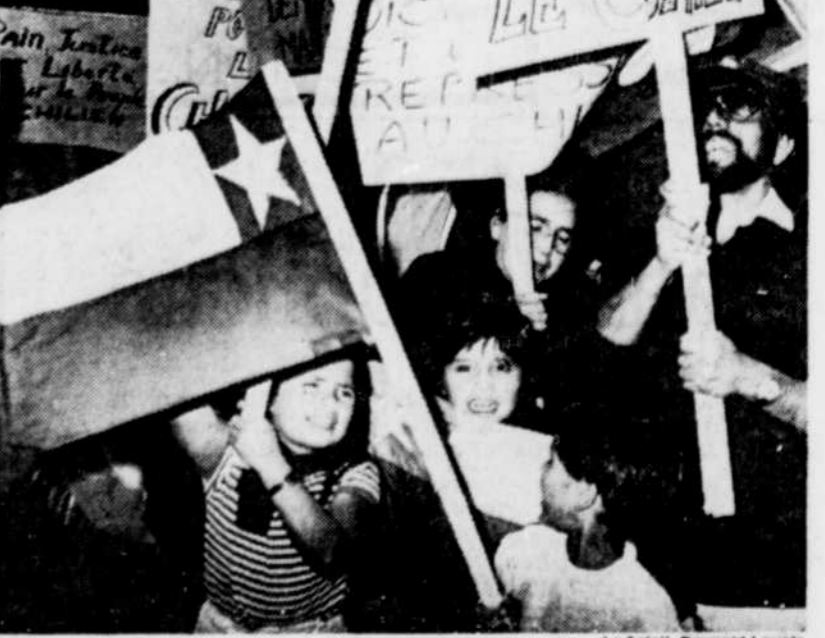
Des membres de la communauté chilienne de Québec, adhérent au Comité d'action Québec-Chili, ont, comme dans plusieurs autres pays, manifesté leur appui à leurs compatriotes qui ont manifesté hier au Chili malgré l'interdiction gouvernementale. Un porte-parole du groupe de Québec a précisé au SOLEIL, lorsque le groupe s'est arrêté devant ses bureaux, que les Chiliens en exil n'exigent même plus la libération des prisonniers politiques. Ce qu'ils souhaitent, c'est le départ du général Pinochet.

service à la suite de la vague d'attentats qui a plus particulièrement touché les autobus, détruisant 10 d'entre eux depuis le début de la semaine. Dans le quartier de Lo Her-