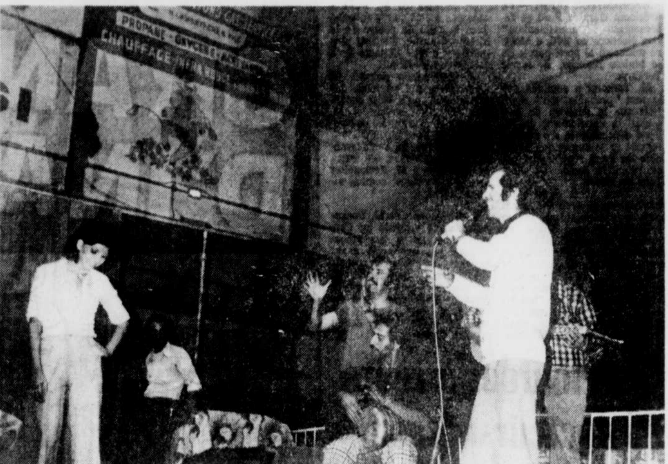
Le spectacle de la délégation libanaise, improvisé à l'aréna de Thetford après la partie de baseball de mardi soir a été fort apprécié d'une foule de quelque 1,000 personnes.