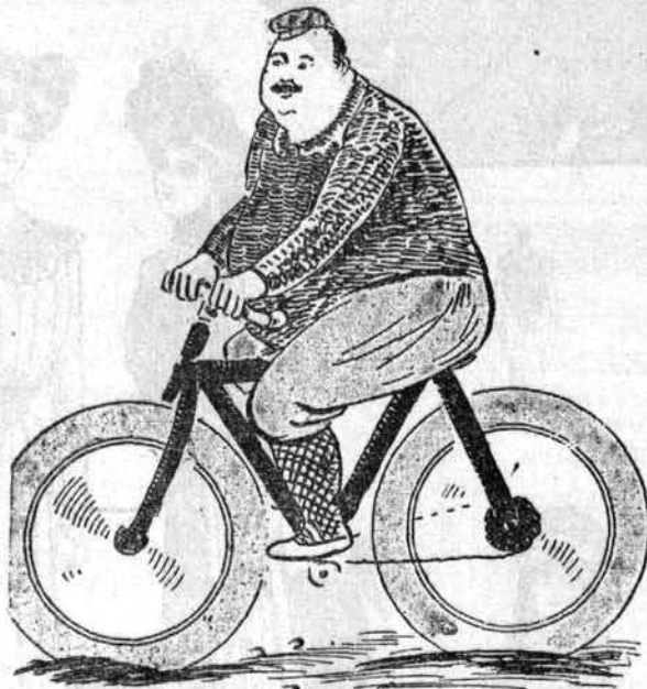
Le bicycliste-rouleau. Il aplanit toutes les difficultés.

UN REMEDE PRATIQUE — Pour guérir les petites plaies anodines qui ne sont que des éraflures de l'épiderme, et qui ne pénètrent pas dans les profondeurs de la peau, il faut tout d'abord les préserver du frottement; mais pour hâter leur guérison, voici une recette facile; on mélange de la glycérine et de la poudre d'amidon, de façon à obtenir un mélange de consistance très pâteuse; on l'applique sur la plaie, et on le maintient avec une bande de taffetas gommé. Cette recette est très utile dans les