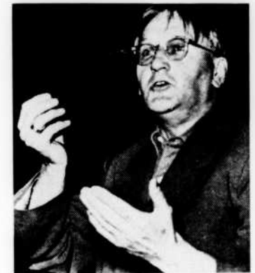
Hermann Scherchen dirigera la Symphonie no 55, «Le Maître d'école», de Haydn, à l'émission «Concert symphonique», le mardi 1er octobre à 9 heures du soir.

1.00—Radio-journal (2 min.) Musique variée