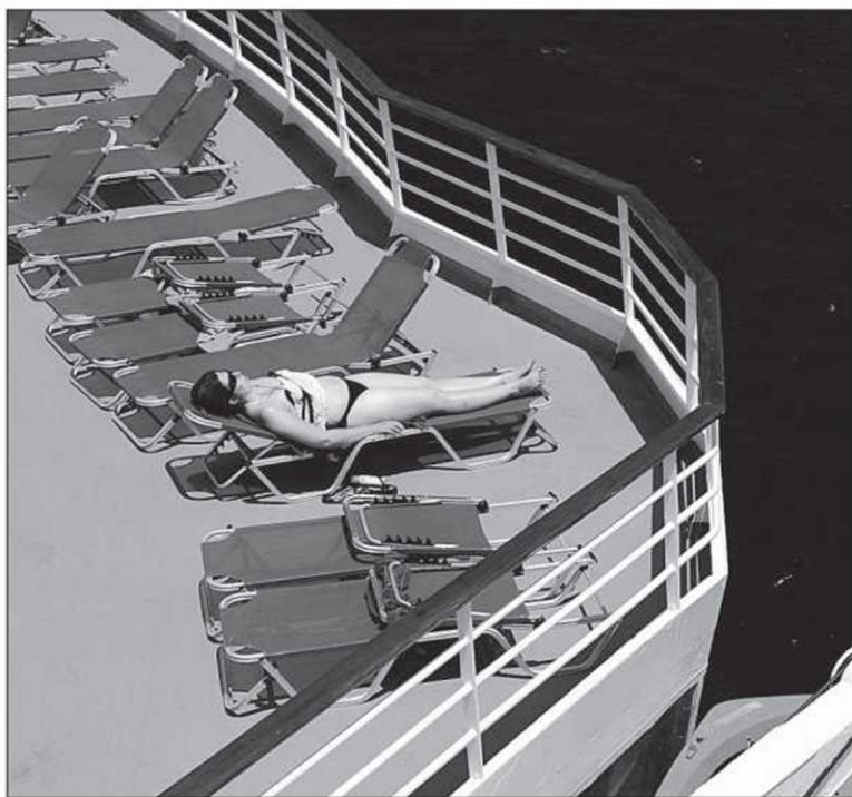
Le taux d'agressions sexuelles répertoriées sur les bateaux de croisière est deux fois supérieur à celui enregistré aux États-Unis.