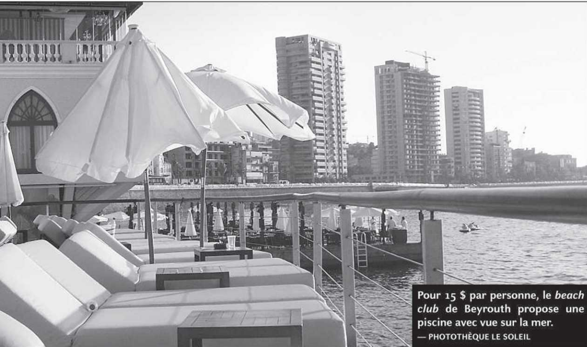
Pour 15 $ par personne, le beach club de Beyrouth propose une piscine avec vue sur la mer.

Au bout de la Corniche, arrêtez-vous au café Manara pour boire une bière, manger quelques mezzés et assister au coucher du soleil sur la Méditerranée. À l'horizon, les villages blancs semblent dévaler le Mont-Liban, la chaîne de montagnes qui entoure la capitale libanaise.