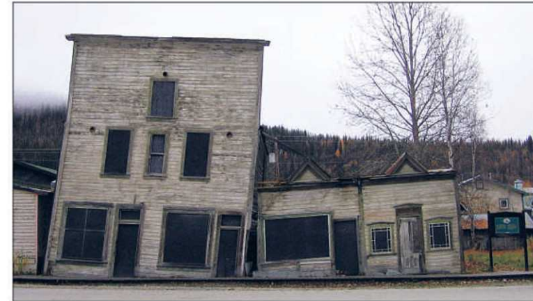
Les maisons «ivres» de Dawson. Ci-dessous : la cabane de Jack London