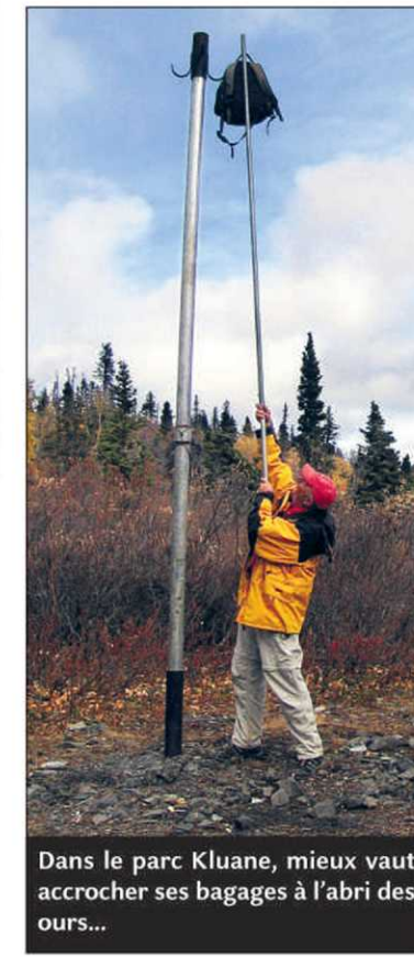
Dans le parc Kluane, mieux vaut accrocher ses bagages à l'abri des ours...

«Le parc Kluane est l'un des plus beaux du Canada. Terrain sauvage par excellence, avec plus de grizzlis que d'humains au mètre carré!»