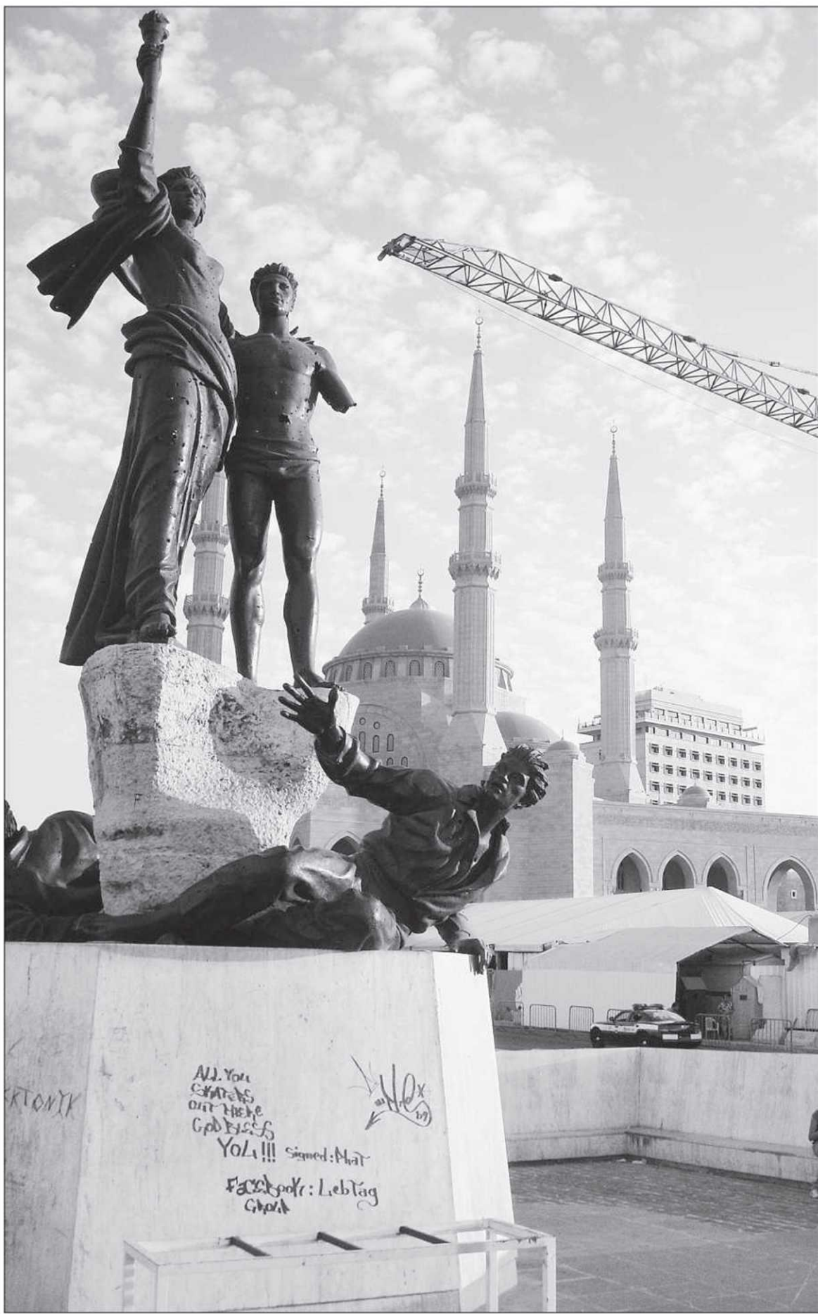
La mosquée Mohammed Al-Amin domine l'entrée est du centre-ville.