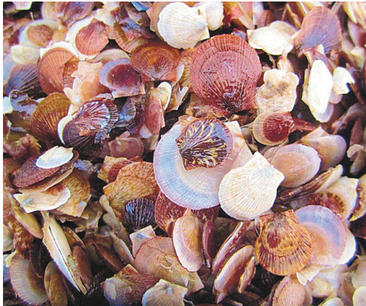
Grâce à des écloséries pour les naissains de pétoncles, les différents producteurs marins du Québec souhaitent bâtir l'avenir.

Passionné, convaincu de la fiabilité de la mariculture au Québec, il se bat pour optimiser les différentes transformations à partir des moules qu'il