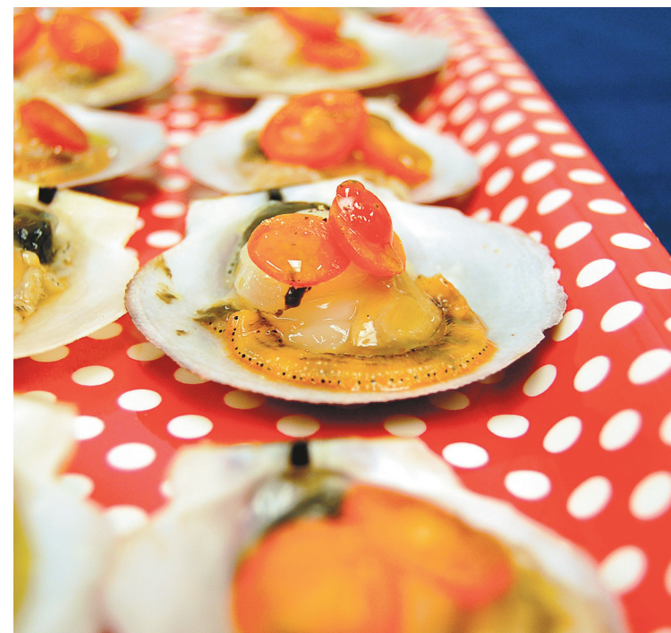
Les petits pétoncles en coquille de la Côte-Nord, d'une fraîcheur et d'une qualité inégalées!