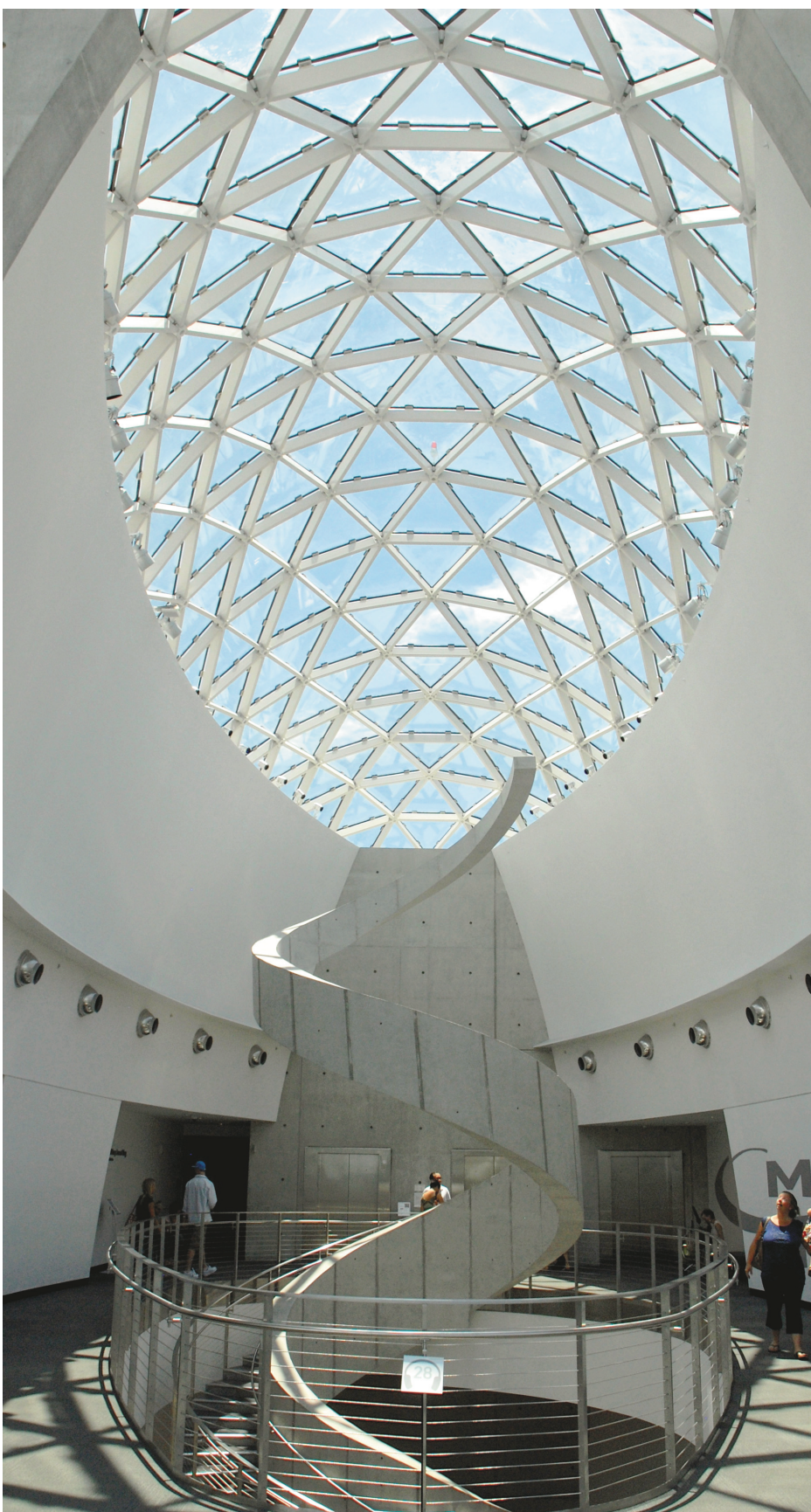
Le musée Dali, à St.Petersburg

La plage de Clearwater est si vaste et si large que la densité de baigneurs y demeure supportable, pour ne pas dire faible, par moments, tandis que le sable, éclatant de blancheur et farineux à souhait, procure un effet si lénifiant entre les orteils qu'on en finit presque par oublier la civilisation.