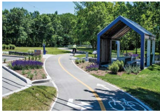
Halte sur la piste cyclable TransTerrebonne