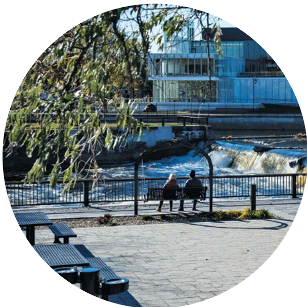
Place des moulins à Joliette

En 2018, le programme a fait peau neuve. Vous trouverez les détails et les nouvelles modalités, en vigueur depuis le 1 er octobre 2018, dans les pages suivantes.