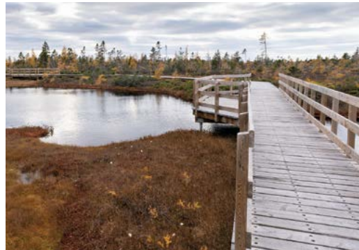
Sentier de la Grande plée Bleue à Lévis