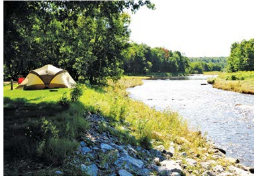
Participation à la restauration de la rivière Noire dans le canton de Roxton