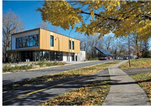
Pavillon d'accueil du Parcours Gouin à Montréal

L'initiative proposée doit être une réalisation durable pour le milieu, en plus de contribuer, dans la mesure du possible, à la visibilité d'Hydro-Québec. Par conséquent, la commandite d'événements, l'achat de matériel consommable ainsi que la réalisation d'études, d'inventaires, de plans et de recherches non liés à l'initiative ne sont pas admissibles.