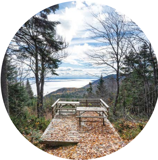
Sentier des caps de Charlevoix