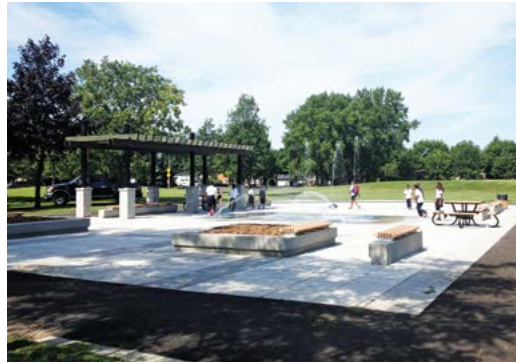
Aménagement de la place Paul-Déjean dans l'arrondissement de Rivière-des-Prairies-Pointe-aux-Trembles