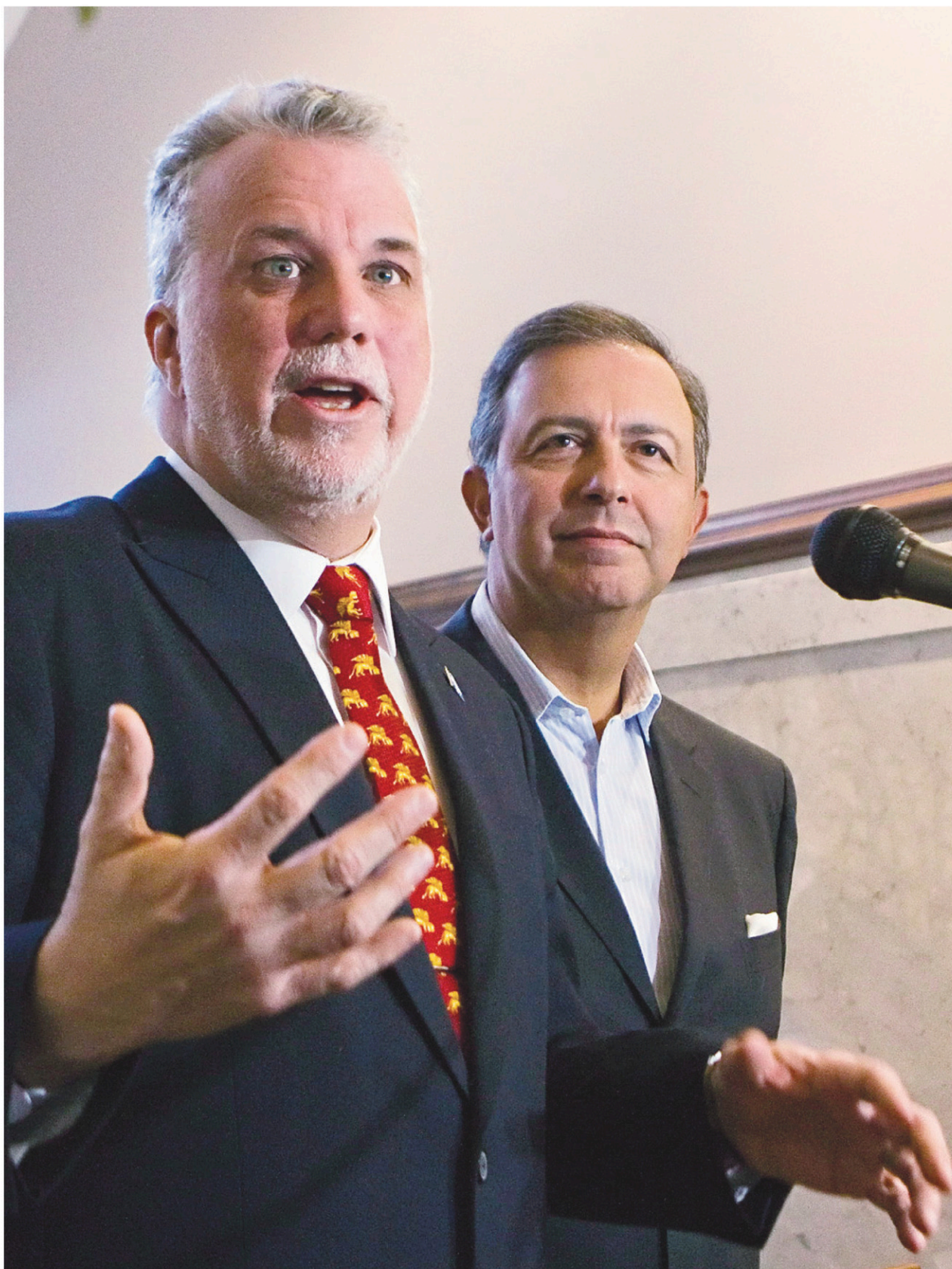
Le premier ministre Philippe Couillard s'est porté à la défense de Sam Hamad, qui s'est retiré temporairement du Conseil des ministres le temps que durera l'enquête du Commissaire à l'éthique et à la déontologie.