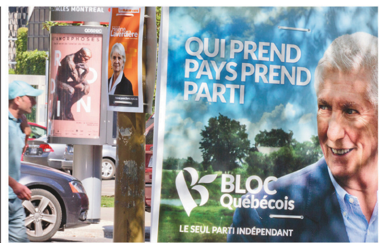
Dans les circonscriptions où la lutte est serrée, l'argent dépensé peut changer le résultat. Ci-dessus, des affiches de Gilles Duceppe (BQ) et d'Hélène Laverdière (NPD), dans Laurier-Sainte-Marie.